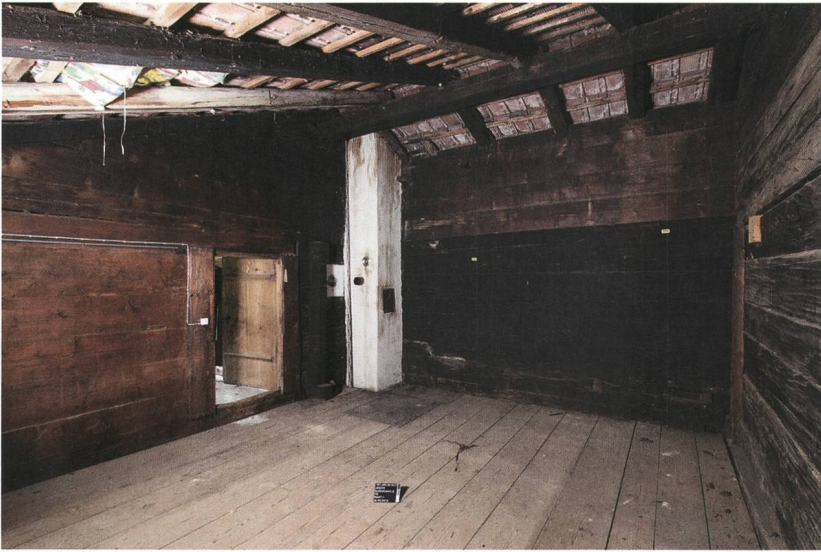
Abb. 4: Aeschi, Suldhaltenstrasse 8. Die beiden Bauholzbestände im oberen Bereich der Rauchküche: Die kantig zugehauenen Blockhölzer zeigen eine kräftige Russchwärzung (rechts der Tür) und die unregelmässiger und gröber zugehauenen Blockhölzer teils eine rötliche Färbung (links der Tür). Blick nach Westen.