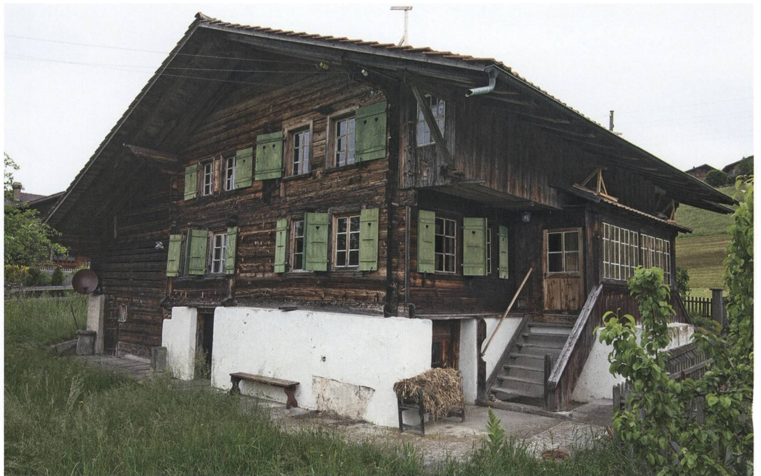
Abb. 1: Aeschi, Suldhaltenstrasse 8. Die südwestliche Giebelseite bildete die Schaufassade, die kaum Bauschmuck zeigte. Im Nordwesten setzt sich der Ökonomieteil deutlich durch die Holzfront ab. Blick nach Norden.

Südlich des Dorfes Aeschi, etwas oberhalb der Landstrasse nach Mülönen stand ein einfaches Bauernhaus (Abb. 1), das mit seiner Giebelfassade nach Südwesten zeigte. Es verfügte über einen Steinsockel und einen darüberliegenden hölzernen Hausteil, auf dem ein Giebeldach ruhte. Mit seiner firstparallel eingerichteten Ökonomie, die das nordwestliche Drittel des Gebäudes einnahm, gehörte das Bauernhaus zum sogenannten «Frutigtyp» und wies damit eine regionaltypische Hausform auf. Bevor das Gebäude im Sommer 2018 abgebrochen und durch einen Neubau ersetzt wurde, konnte es bauarchäologisch untersucht und dokumentiert werden.