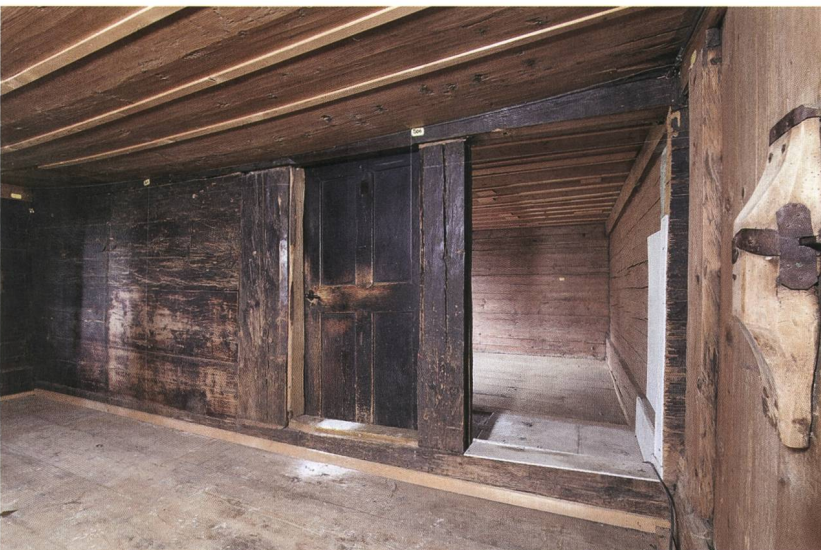
Abb. 5: Aeschi, Suldhaltenstrasse 8. Die Binnenwand zwischen den Gaden zeigt auf einer Seite eine deutliche Russchwärzung, die innerhalb eines Gadens sehr ungewöhnlich ist.

Russchwärzung und andererseits teils grob zugehauene Hölzer, die an den Kanten oftmals noch über ihre Waldkante, also die natürliche Stammrundung, verfügten und die eine geringere Russfärbung aufwiesen. Diese zwei Holzbestände liegen sauber getrennt, aber dennoch übereinander geschichtet vor. So besteht beispielsweise die Gadenrückwand nordwestseitig der Türe aus den schwarzen Kanthölzern, nordostseitig der Türe hingegen aus rötlichen Hölzern (vgl. Abb. 4). Im Bereich der Giebelfassaden sind diese zwei Blockholzbestände jeweils in Wandständer eingebunden und auf diese Weise etwas unbeholfen miteinander verbunden. Als weiteres Indiz für die Verbauung alter Bauholzbestände ist die starke, einseitige Russchwärzung der Gadenbinnenwand zu werten, die an dieser Lage ungewöhnlich ist, es sei denn,