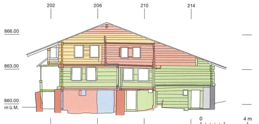
Abb. 3: Aeschi, Suldhaltenstrasse 8. Querschnitt durch das Gebäude. Rot: Grundkonstruktion; orange: jüngerer Umbau oder zweiter Bauholzbestand; blau: diverse Zumauerungen; grün: Umbau (19. Jh.); grau: jüngste Umbauten mit Zement. Blick nach Südwesten. M. 1:200.