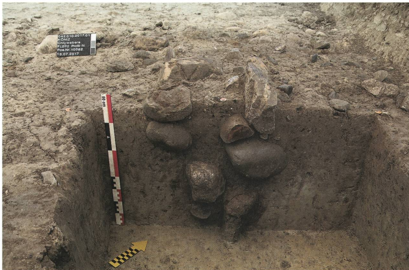
Abb. 1: Köniz, Chlywabere BLS. Mittelbronzezeitliche Pfostengrube mit Keilsteinen.

Der geplante Doppelspurausbau der BLS-Linie führte in den Jahren 2017 und 2018 zu einer Rettungsgrabung des Archäologischen Dienstes des Kantons Bern. Seit 1972 ist die römische Villa im Westen des Bahntrassees bekannt. Die Sondierungen respektive Testgrabungen der Jahre 2012 bis 2014 ergaben zudem neolithische und