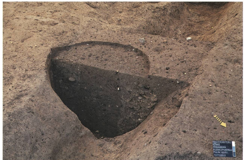
Abb. 4: Köniz, Chlywabere BLS. Eine Pfostenreihe schneidet einen älteren Dränagegraben.