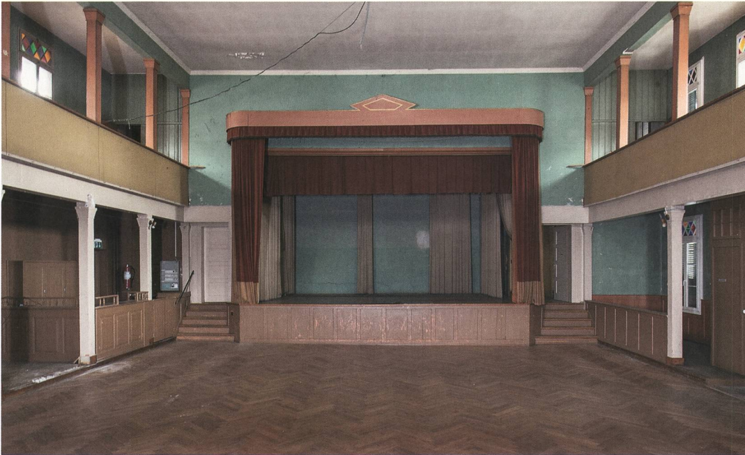
Abb. 6 Steffisburg, Oberdorfstrasse 32. Blick nach Süden in den angebauten Saal mit Bühne vor der Sanierung. Aufnahme von 2017.

1951 liess der Eigentümer seine Gastwirtschaft modernisieren: Der bislang nicht unterkellerte südliche Teil des Landhauses wurde nun mit einem Untergeschoss versehen, das Lager- und Nebenräume enthält. Im Erdgeschoss ersetzte man grosse Teile der Aussenmauern und veränderte die Fenstergliederung, ferner stattete man die Gaststube neu aus und baute im östlichen Teil ein Säli ein. Die Gastwirtschaft im Erdgeschoss und die Räume im ersten Obergeschoss waren fortan mit einer internen Treppe verbunden.