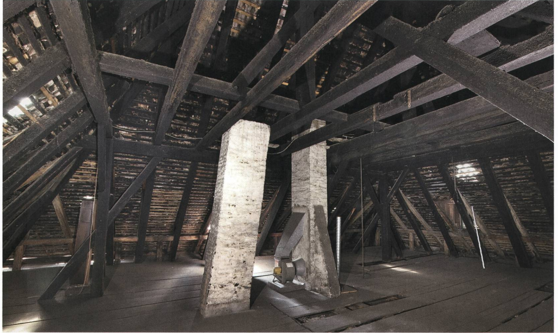
Abb. 5 Steffisburg, Oberdorfstrasse 32. Blick nach Südwesten in das Dachwerk. Aufnahme von 2017.

Korridor mit einem Steinplattenboden belegen. Die Gerichtsstube und die Wohnstube bekamen eine barocke Holztäferung. Dies ist der erste schriftlich belegte Umbau des Landhauses.