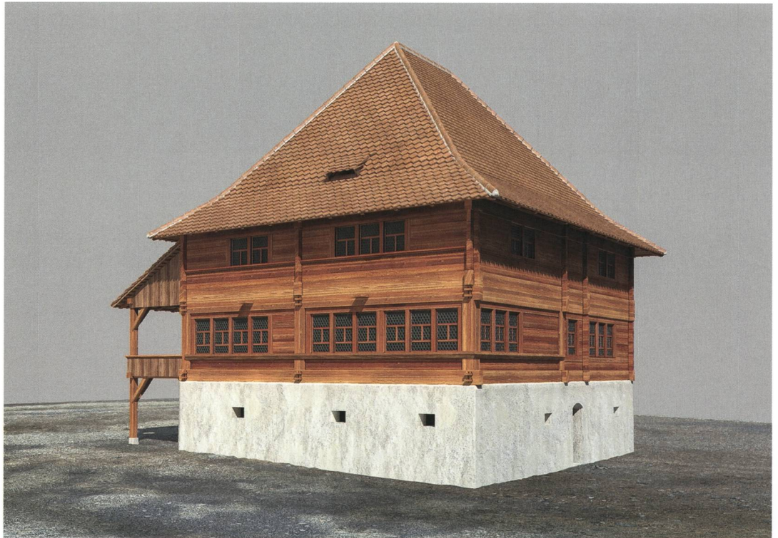
Abb. 2: Steffisburg, Oberdorfstrasse 32. Rekonstruktionsversuch zum Aussehen des Landhauses kurz nach seiner Erbauung 1543.

Nach mehrjährigem Leerstand beschloss die Eigentümerschaft, das Landhaus mit dem 1876–1878 angebauten Saal zu sanieren und einer neuen Nutzung zuzuführen. Eingerichtet wurde darin ein medizinisches Zentrum. Das Gebäudeensemble ist im kantonalen Bauinventar als schützenswert eingestuft und grundeigentümerverbindlich geschützt, weshalb die Kantonale Denkmalpflege zu einem frühen Zeitpunkt über die Planungsabsichten informiert wurde. Um zu verhindern, dass beim bevorstehenden Umbau aus Unkenntnis in verborgene, historisch wertvolle Bausubstanz eingegriffen wird, beschloss die Denkmalpflege, vorab eine umfassende Bauuntersuchung durchzuführen. Unterstützt wurde sie dabei vom Archäologischen Dienst des Kantons Bern, der dendrochronologische Analysen sowie Beobachtungen zum Mauerwerk und zum Dachstuhl durchführte und Teilbereiche zeichnerisch dokumentierte. Die weiteren Massnahmen, die Quellenrecherche, die Bauanalyse vor Ort, die fotografische Dokumentation und die Auswertung mit Bericht in Schrift und Plan, lagen bei der Denkmalpflege. Es ist dies ein Beispiel für die gelungene praxisgerechte Zusammenarbeit der beiden kantonalen Fachbehörden im Bereich einer umfangreichen Bauuntersuchung.