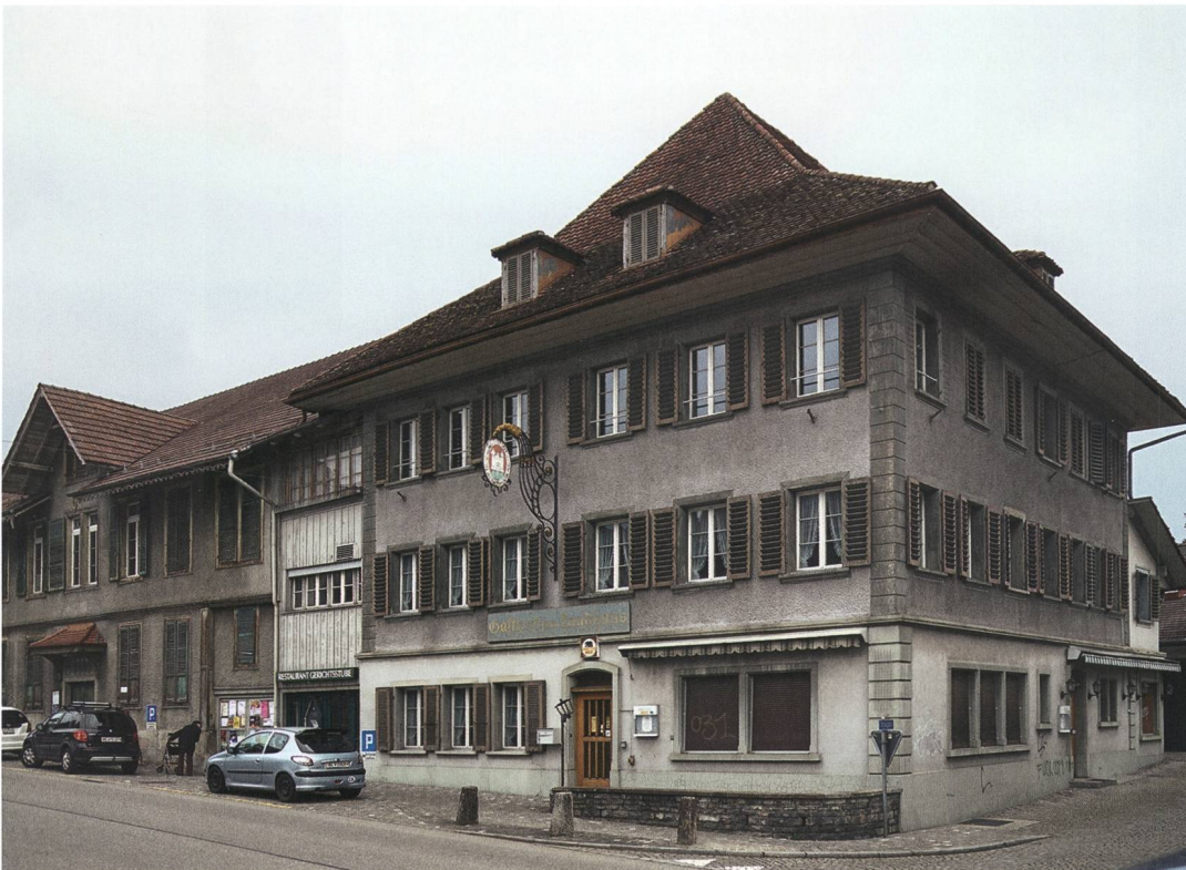
Abb. 1: Steffisburg, Oberdorfstrasse 32. Aufnahme des Gebäudes von 2017. Blick nach Nordosten.

einheit, die das ganze Zulgtal von Heimberg bis ins Eriz, unter Einschluss von Goldwil und Heiligenschwendi, umfasste. Dazu kamen noch die Ortschaften Brenzikofen und Herbligen sowie während der Helvetik (1798–1803) die Landgemeinden im Aaretal bis hinab nach Wichtlach. Das Dorf Steffisburg mit dem Landhaus bildete das zugehörige administrative Zentrum. Seit 1549 wurde im Landhaus auch eine Gastwirtschaft betrieben, zu der auf der Rückseite ein Ofenhaus mit einer Schaal (Schlachthaus) gehörte. 1581 richtete man im zweiten Obergeschoss eine Freistatt ein, in der Gesetzesbrecher im Vorfeld der Gerichtsverfahren Zuflucht suchen konnten. Im Zuge der rechtlichen und behördlichen Neuordnung des Kantons Bern wurde der Landschaftsverband 1872 aufgelöst. Das Landhaus war bereits 1864 in Privatbesitz übergegangen.