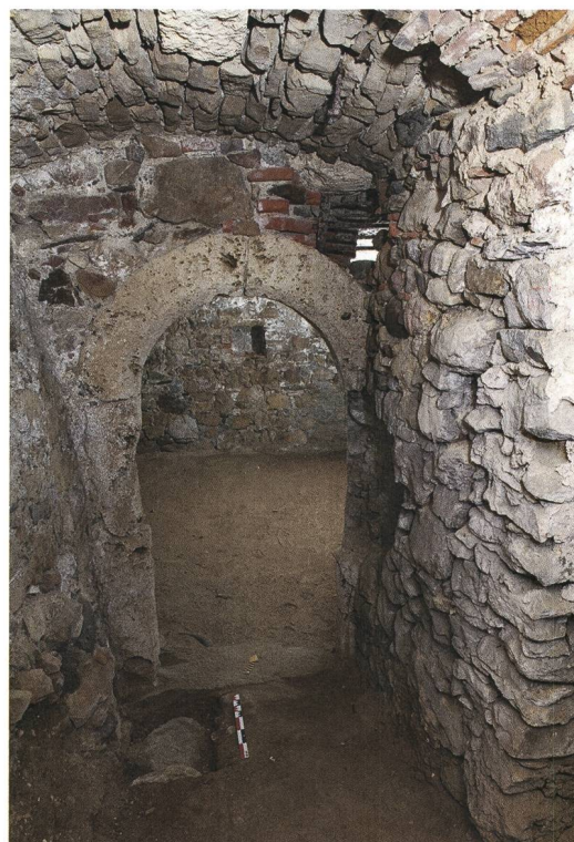
Abb. 6: Wiedlisbach, Städtli 29. Blick von Kellervorraum 02 in den frühneuzeitlichen Keller 01 der Zeit nach 1600. Blick nach Norden.

Gleichfalls wurde damals das Areal zwischen Stadtmauer und südlicher Gebäudefassade