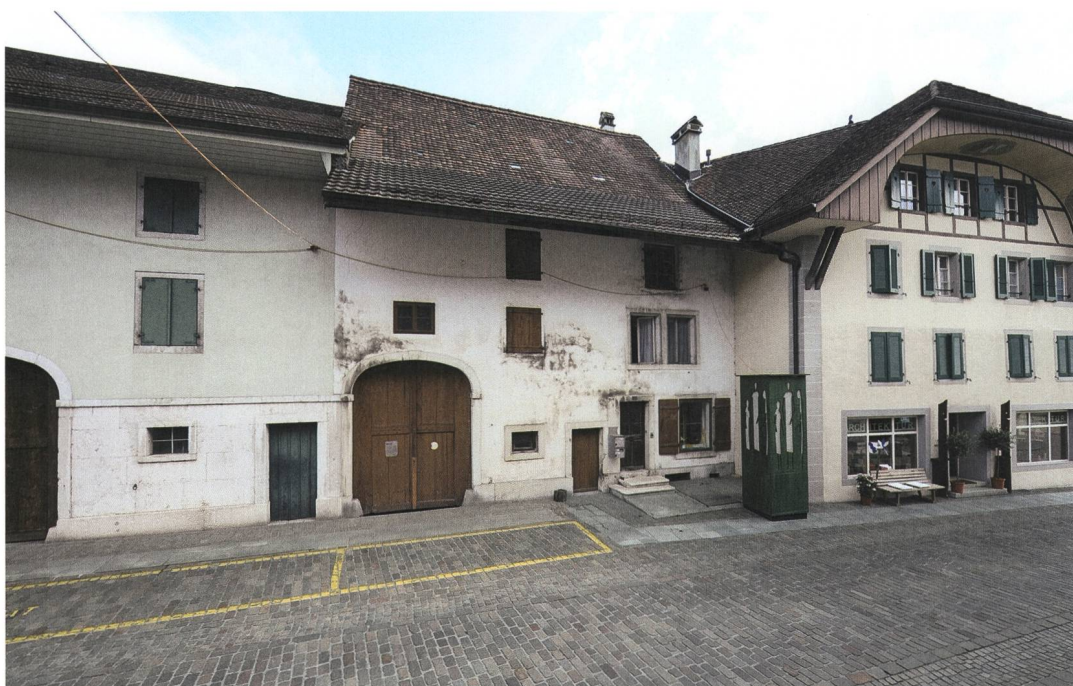
Abb. 1: Wiedlisbach, Städtli 29. Nordfassade von 1852. Blick nach Südwesten mit den Nachbarhäusern Städtli 27 (links) und Städtli 31 (rechts).

Erwähnt wird der Ort erstmals in Schriftquellen des Jahres 1275 als «Wietilspach» beziehungsweise «Wiechtispach». Damit liegt ein gesicherter terminus ante quem für die Gründung der Stadt vor, die demnach unbestimmt lange zuvor entstanden sein muss. Da der Ort 1275 als oppidum bezeichnet wird, scheint er damals schon befestigt und wohl auch städtisch geprägt gewesen zu sein. Als Gründungsvater der Stadt gilt der Frohburger Graf Ludwig der Ältere (1212–1257/1259), der in der ersten Hälfte des 13. Jahrhunderts in der Region über grossen grundherrschaftlichen Einfluss verfügte.