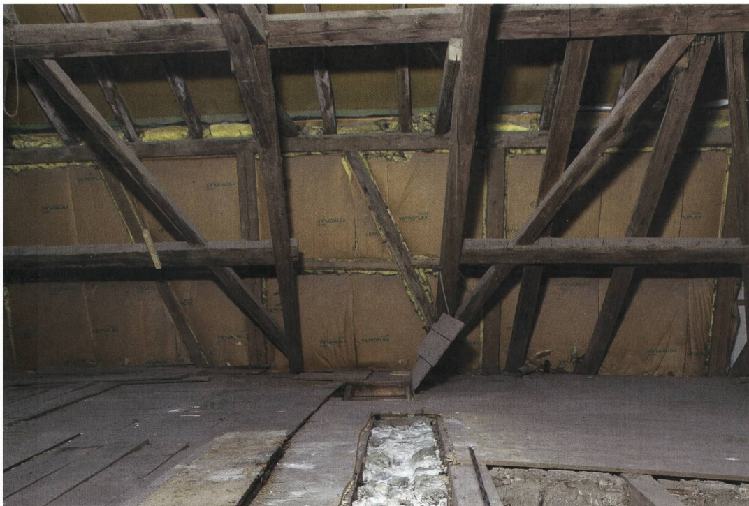
Abb. 7: Wiedlisbach, Städtli 29. Blick in das Dachgeschoss mit dem liegenden Dachstuhl von 1695/96d und der Trennwand zwischen Wohn- und Ökonomieteil. Blick nach Südosten.

überbaut (dunkelgrün). Die alte Südfassade wurde zum Teil abgebrochen, um die Räume bis zum Verlauf der ehemaligen Stadtmauer erweitern zu können. Auf allen Etagen fügte man neue Binnenwände in Riegkonstruktion ein. Spätestens jetzt wurde der Ökonomiebereich zur Tierhaltung und Lagerung von Heu verwendet. Ob auch zuvor eine landwirtschaftliche Nutzung bestanden hat oder aber Handwerker und Händler in der Liegenschaft wohnten, ist derzeit nicht zu entscheiden. Die Planierschicht über der Berme mit neuzeitlichen Hafnereiabfällen um 1770 bis 1800 scheint jedenfalls keinen Bezug zur Parzelle und deren Bewohner zu haben.