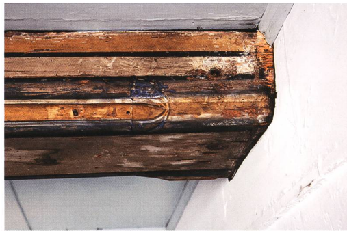
Fig. 7 : La Neuveville, rue du Collège 5. Détail de la tête de la solive médiane datée de 1506/07. Le solivage et le plafond furent peints ultérieurement, probablement au 18 e siècle.