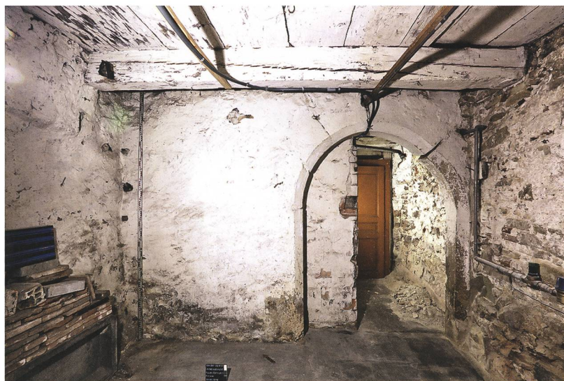
Fig. 5: La Neuveville, rue du Collège 5. Rez-de-chaussée. Porte de cave (pos. 36) à encadrement en plein cintre orné d'un large chanfrein terminé par un congé oblique. Elle serait associée à un réaménagement daté de 1489. Vue en direction de l'est.