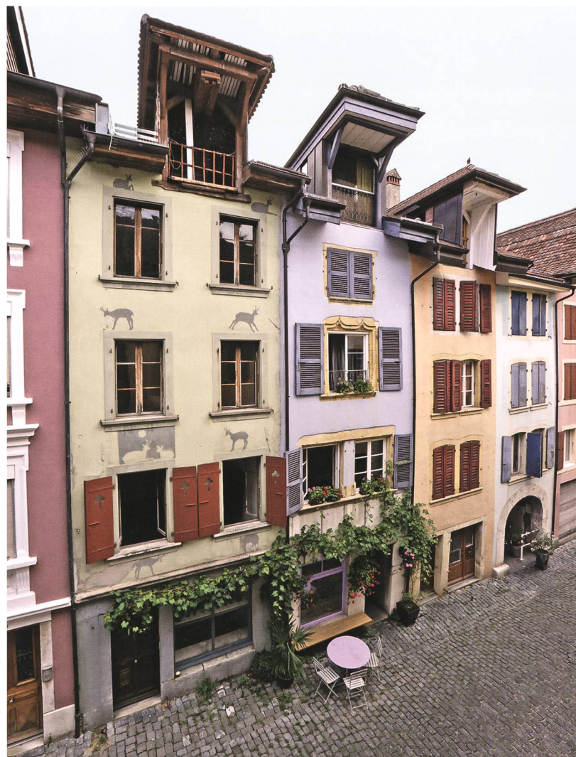
Fig. 1 : La Neuveville, rue du Collège 5. La façade ouest du bâtiment a été remaniée au 20 e siècle; elle est animée par quelques silhouettes de chamois.

Le rez-de-chaussée livra les restes ténus mais indiscutables du mur d'enceinte (fig. 4, pos. 44) de la cité médiévale, contre lequel s'appuyaient les murs mitoyens de la maison sous revue. Le mur mitoyen sud portait d'importantes traces de rubéfaction qui témoignaient d'un incendie violent. Il n'est pas clair à ce stade, si le feu toucha le bâtiment situé au sud ou un édifice en bois dressé librement sur la parcelle étudiée.