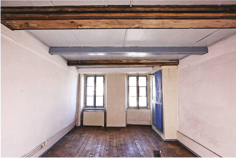
Fig. 6 : La Neuveville, rue du Collège 5. Les solives du plafond de la pièce 16, au 2 e étage, étaient moulurées et se rapportaient à une phase de transformation ou de rehaussement du bâtiment datée de 1507. Le plafond fut renforcé ultérieurement par des solives supplémentaires. Vue vers l'est.