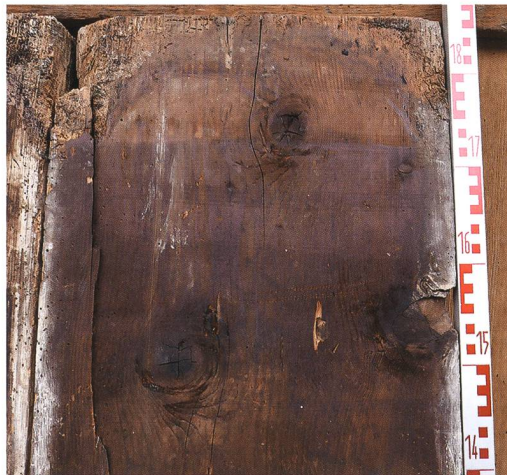
Fig. 8 : La Neuveville, rue du Collège 5. Madrier découvert en remploi dans le sol de la cuisine du 1 er étage. Daté de 1507 par la dendrochronologie, il appartenait au plafond-plancher du 2 e étage.

appliqué un décor peint de filets noirs, ocres et gris-bleu, dont il ne subsistait que quelques traces. Un décor similaire fut observé sur le plafond lambrissé de la pièce 16 décrite plus haut.