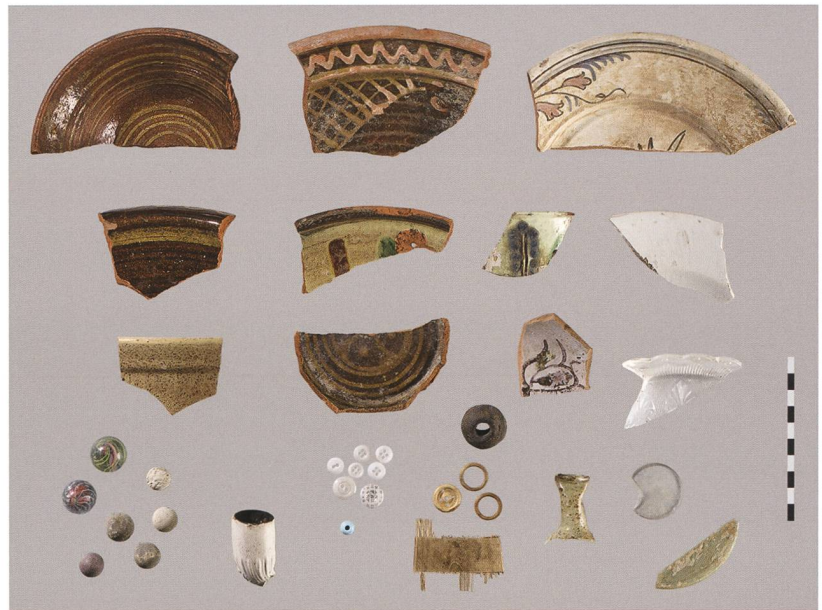
Fig. 8 : Petit-Val, Souboz, Haut du Village 37. Aperçu du mobilier archéologique mis au jour : vaisselle en terre, lot de billes, pipe en terre, boutons et verrerie reflétant trois siècles d'occupation.

La maison paysanne du Haut du Village 37 n'a subi que peu de transformations et sa structure d'origine est bien conservée. Le logement s'articulait autour d'une grande cuisine voûtée en position centrale. Le séjour, dont les murs étaient couverts d'un lambris finement ouvragé, disposait d'un poêle qui fut remplacé en 1904. Deux pièces situées à l'étage et remaniées au 19 e siècle complétaient le logis. Cette ferme reprend le modèle largement diffusé des fermes à poteaux verticaux, en vogue jusqu'à la fin du 18 e siècle dans le Jura. Toutefois, elle se distingue par une curiosité architecturale : un entrain traversant, assemblé à mi-bois aux poteau repose sur le couronnement du mur, tandis que les extrémités inférieures desdits poteaux dépassent et sont intégrés au corps de maçonnerie.