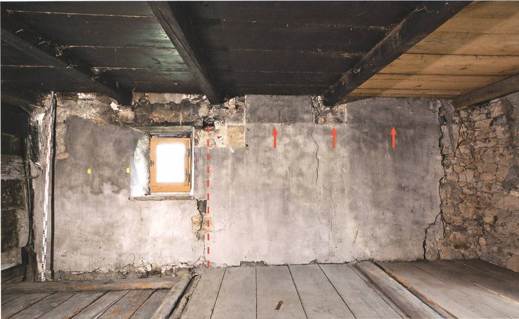
Fig. 7 : Petit-Val, Souboz, Haut du Village 37. Chambre nord. On remarque sur le mur nord, juste à droite de la fenêtre, la trace d'une cloison disparue (tireté) et surtout un rehaussement du plafond (daté vers 1820/25) marqué par un rhabillage de l'enduit (flèches).

de la vaisselle culinaire provenant de Bonfol, quelques fragments de pipes en terre, mais aussi de la vaisselle en verre, de menus objets en os et en verre, ainsi que de nombreuses billes en matériaux divers (fig. 8). Du verre à vitre a aussi été mis au jour, notamment des fragments de cives. Quoique fabriquées en masse dans les verreries toutes proches de Court, leur attestation en contexte de fouille restait plutôt rare dans la région jurassienne. Par ailleurs, de nombreuses chutes de cuir épais et des fragments de sangles découverts dans la cave paraissent témoigner d'une activité de sellier ou bourrelier, peut-être au début du 20 e siècle.