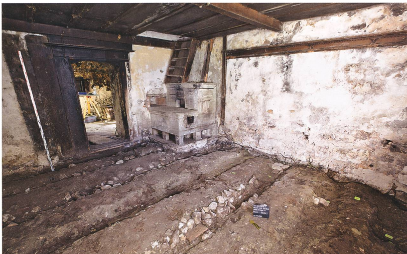
Fig. 4 : Petit-Val, Souboz, Haut du Village 37. Séjour. Négatifs de solives, fourneau en molasse de 1904 et escalier accédant à la pièce de nuit. À droite, on devine les maigres vestiges de lambris encore conservés.