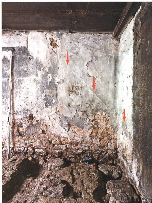
Fig. 5 : Petit-Val, Souboz, Haut du Village 37. Séjour. Fondation et traces sous les enduits muraux de l'escalier d'origine (flèches) qui longeait le mur ouest.