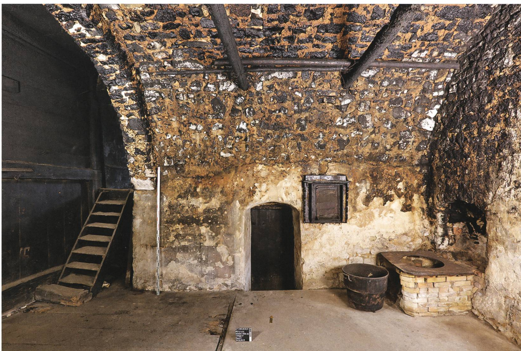
Fig. 3 : Petit-Val, Souboz, Haut du Village 37. Mur nord de la cuisine voûtée. À gauche, on distingue l'escalier accédant à la chambre nord, au centre la porte de cave et à droite la chaudière moderne en briques.

Le séjour, aussi nommé « poile » ou « belle chambre » dans le Jura, constituait avec ses quelque 20 \text{ m}^2 la seule pièce chauffée de la maison paysanne (fig. 4). À l'origine, ses murs devaient être enduits, mais ils furent rapidement habillés de délicats lambris soulignés de frises denticulées, dont il ne reste malheureusement que de maigres reliques. La porte est surmontée d'une corniche moulurée dont la typologie renvoie à la fin du 17 e siècle; on retrouve d'ailleurs sur le linteau, la même petite frise