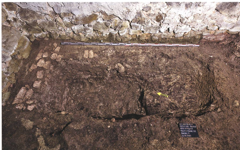
Fig. 6 : Petit-Val, Souboz, Haut du Village 37. Cave. Fosse garde-manger creusée dans le terrain naturel marneux.

denticulée observée sur le lambris. Un escalier quart-tournant accédait depuis le séjour à une chambre située juste au-dessus. De l'escalier d'origine, il ne restait que les fondations, apparues sous le plancher, et une empreinte perceptible dans l'enduit mural (fig. 5). Une ouverture coulissante aménagée dans le plafond-plancher d'origine devait permettre à la chaleur dégagée par le poêle de tempérer la pièce. Actuellement, l'accès de la chambre s'avère peu commode puisqu'il se fait par un escalier bancal en remploi qui prend appui sur le fourneau en molasse daté de 1904. Ce dernier remplaça un poêle antérieur, dont il reprit le socle en gros moellons calcaires ; l'escalier partait alors à l'opposé et on y accédait depuis un escabeau mobile. Au 17 e siècle, cette chambre haute fut sans doute l'unique pièce de nuit.