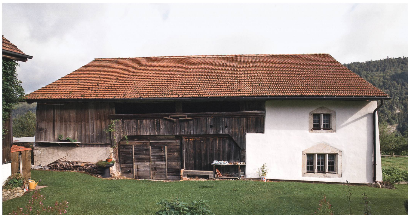
Fig. 1 : Petit-Val, Souboz, Haut du Village 37. Façade sud du bâtiment. Au centre, la porte du devant-huis et, à droite, le corps de maçonnerie percé de deux baies à meneaux.

Le terrain étant en légère pente, le rez-de-chaussée présente des différences de niveaux compensées par des marches ou un plancher légèrement incliné (fig. 2). L'entrée principale se situe à l'est et débouche sur la cuisine voûtée (fig. 2 et 3) qui forme la pièce centrale du lo-