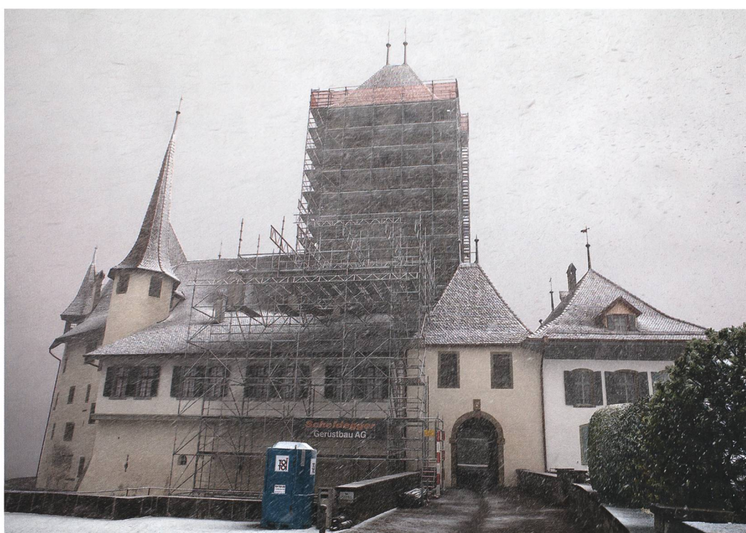
Abb. 1: Spiez, Schloss. Der eingerüstete Turm im Schneegestöber im Winter 2018/19. Blick nach Osten.

Die Mauerstärke beträgt im Sockelbereich ungefähr 3 m und verjüngt sich bis zur Wehrplatte auf 1 m (Abb. 3). Die Zinnen sind auf drei Seiten 0,9 m stark, auf der vierten im Osten wegen des im Mauerwerk integrierten Kamins 1,30 m.