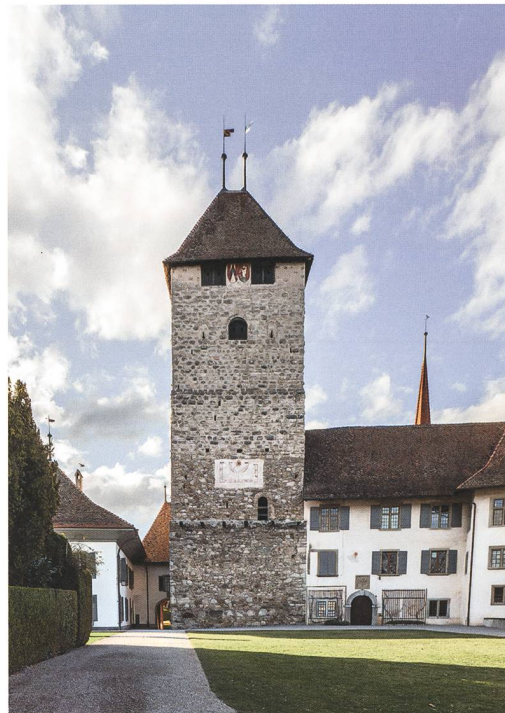
Abb. 5: Spiez, Schloss. Die hofseitige Fassade (Ostfassade) des Turms im Frühling 2019. Zu berücksichtigen ist, dass die untersten 4 m des Turmes nicht sichtbar sind, weil sie in einer Grabenaufschüttung stecken. Blick nach Nordwesten.

Markus Leibundgut und Matthias Bolliger. Spiez, Schloss, Turm. Dendrochronologischer Untersuchungsbericht 2019. Archäologischer Dienst des Kantons Bern. Gemeindefacharchiv, FP-Nr. 339.009.2019.01.