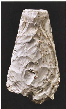
Abb. 2: Thörigen, Radigs. Unterseite des Beils. M. 1:3.