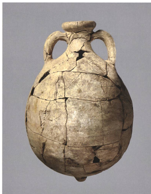
3 Die fast vollständige, restaurierte Amphore des Typs Dressel 20 aus Aegerten. M. 1:10.

Obwohl es sich um einen Einzelfund handelt, liefert diese «verlorene» Amphore auch Hinweise darauf, dass wir uns im Umfeld einer Hafenanlage befinden. Einerseits sind so