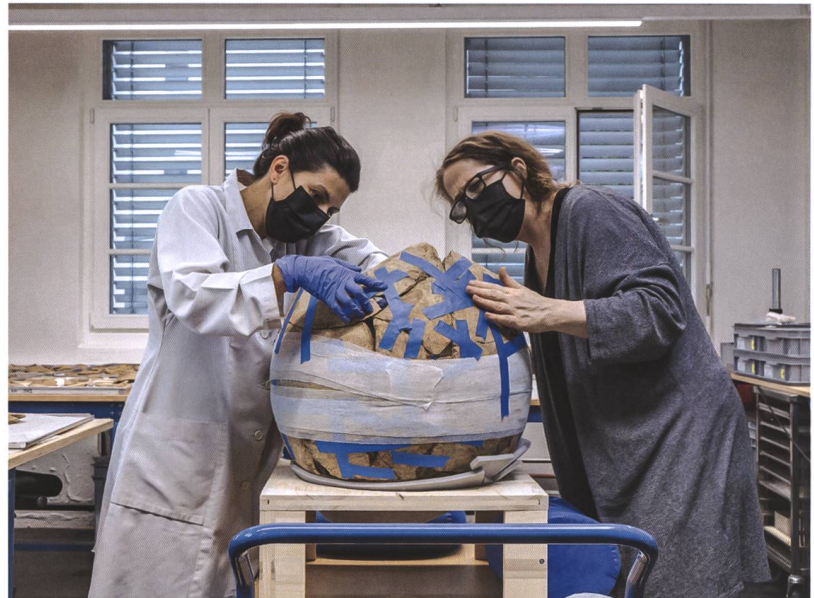
2 Restaurierung der Amphore im Fundlabor des Archäologischen Dienstes.

Eine römische Inschrift aus Aventicum bietet Anhaltspunkte zum korporativ organisierten Flusstransportwesen. Das Zunfthaus der Aareschiffer, der nautae Aruranci Aramici , ist an zentraler Stelle beim Forum von Aventicum verortet. Diese prominente Lage unterstreicht die Bedeutung der Vereinigung der Flussschiffer als auch des Transportwesens. Der Fund belegt zudem, dass in römischer Zeit Waren auf den Aare- und Juragewässern (Aare, Zihl sowie den Juraseen) transportiert wurden. Ebenfalls in den Zuständigkeitsbereich der nautae fiel das