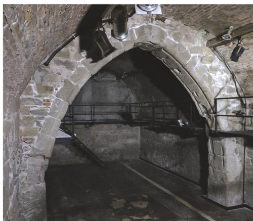
1 Bern, Kramgasse 4. Der Gurtbogen von Süden. Die ungleichmässig breiten Fugen geben bereits einen Hinweis darauf, dass der Bogen nicht original an dieser Stelle sitzt, sondern wiederverwendet und ohne grosse Sorgfalt aufgemauert wurde.

Das älteste nachweisbare Mauerwerk (2; erste Phase, rot) war im Südteil der Ostwand zu fassen (Abb. 4). Es endet im Norden an einem Wundverband, der entstanden war, als die im Verband stehende Nordmauer (6) abgebrochen wurde. Weitere zugehörige Mauern fehlen ebenso wie Öffnungen oder Hinweise auf einen Boden und eine Decke. Es lässt sich ein rund 7 m tiefer Keller von unbekannter Breite rekonstruieren. Das Mauerwerk besteht aus gleichmässig behauenen und lagig vermörtelten Sandsteinquadern und enthält an einigen