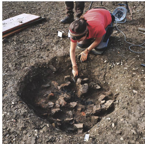
2 Münsingen, Entlastungsstrasse Nord. Eine Grube (Pos. 2374) mit verbrannten Hölzern und viel spätbronzezeitlicher Keramik wird ausgegraben. Blick nach Nordwesten.

Unter den römischen Mauern und Böden im Nordteil der Grabungsfläche erhielten sich zwei rund 2,5 m grosse Gruben aus der Hallstattzeit (8.–5. Jh. v. Chr.). In einer zeigten sich Hinweise auf einen rechteckigen Holzeinbau, möglicherweise diente diese Grube der Vorratshaltung. Zu einem späteren Zeitpunkt wurde auf der Nordseite der Einbau herausgerissen, ein durch Hitzeeinwirkung mürbe gewordener Gneis (1,2 × 0,5 × 0,3 m) in die Grube hineingeworfen und daneben ein aufwendig verziertes Gefäss deponiert. In der anschliessenden Auffüllung der Grube fand sich neben Keramikscherven auch eine Paukenfibel (6. Jh. v. Chr.). Das Fehlen von menschlichen Knochen macht eine Interpretation der Grube als Grab unwahrscheinlich.