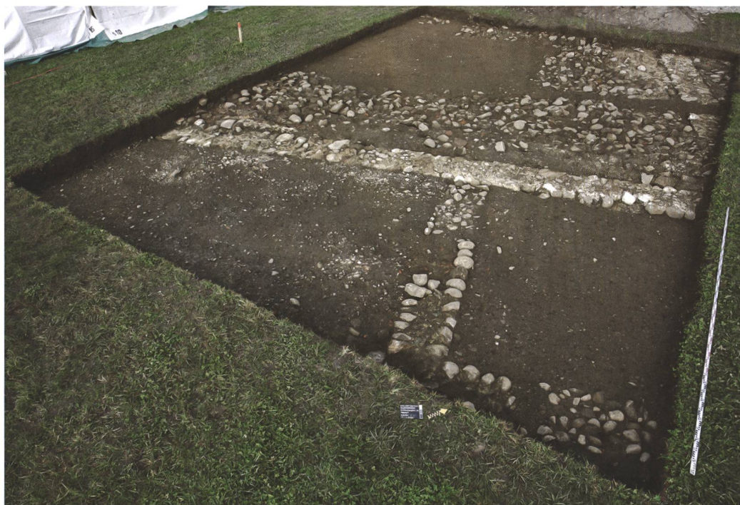
7 Münsingen, Entlastungsstrasse Nord. Direkt unter dem modernen Pflughorizont liegende Fundamente des römischen Steinbaus. Im Vordergrund zwei kleine, südseitige Räume, im Hintergrund der Südostteil des grossen Raums, verfüllt mit Abbruchschutt. Blick nach Nordwesten.

Sohle liegender grossfragmentierter Keramikscherben ebenfalls in die späte Latènezeit zu datieren. Dies bestätigt eine Radiokarbondatierung. Der nördliche Graben (Pos. 624) war lediglich 1,2 m breit und lieferte kaum Funde aus den unteren Auffüllungen, die jüngste enthielt bereits römische Dachziegel. Aufgrund seiner Lage und Orientierung dürfte er in der Spätlatènezeit ausgehoben worden sein. Holzkohleproben aus den Auffüllungen werden eine genauere Datierung erlauben.