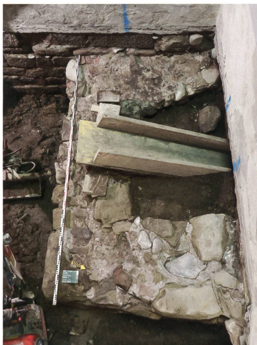
5 Bern, Gerechtigkeitsgasse 21. Blick auf das Fundament des älteren Treppenturms (19) (Abb. 2) mit der Unterlage für die erste Wendeltreppentstufe. Blick nach Westen.

des Fundaments werfen die Frage auf, ob es sich dabei um die Rückseite eines bauzeitlichen Kellers des Nachbargebäudes Gerechtigkeitsgasse 19 handeln könnte. Eine andere Möglichkeit wäre, dass die markanten Niveauunterschiede mit einer frühen Steigungskorrektur zwischen Nideggstalden und der unteren Gerechtigkeitsgasse einhergehen. Aufgrund der Befunde der Untersuchung in der nahen Liegenschaft Gerechtigkeitsgasse 7 ist von Letzterem auszugehen (Archäologie Bern 2010, 64f.). Dort wurde beobachtet, dass man im 14. Jahrhundert ein bestehendes Gebäude um 1,5 m unterfing und dass dies mit einer möglichen ersten Gassenabsenkung zu tun haben könnte.