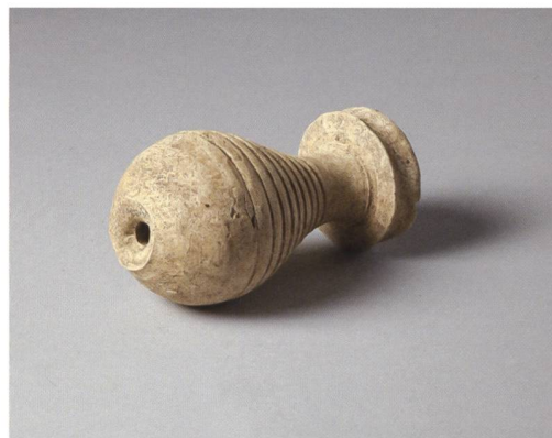
6 Ins, Riserenweg 13. In der Grube 9 konnte ein als Amphorenverschluss oder als Salbgefäss interpretiertes Tongefäss geborgen werden. M. 1:3.

wird die Begleitung kommender Um- und Neubauten den Wissensstand zu dieser einst isoliert auf einer Koppe gelegenen Gutshofanlage stetig erweitern.