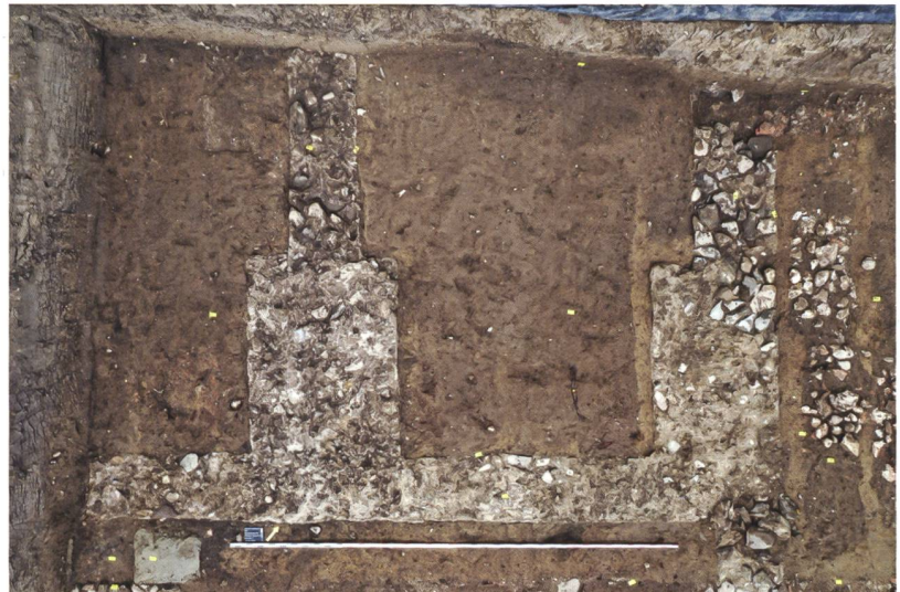
5 Ins, Riserenweg 13. Detail der Mauern des Nordgebäudes (römisch, jüngere Phase; Abb. 3, Nrn. 30 und 32) mit deutlichen Verbreiterungen der Fundamente.

Durch die Rettungsgrabung am Riserenweg 13 in Ins wurden nun die Reste eines römischen Gutshofes bestätigt. Trotzdem bleibt die Frage nach der Grösse und Ausdehnung des Gutsbetriebes sowie die ungefähre Zeit seiner Nutzung offen. Die Ausdehnung des Gutshofes lässt sich auch anhand der verschiedenen älteren Fundmeldungen nur teilweise erfassen. Da in dem Einfamilienhausquartier noch einige Flächen un bebaut und auch angrenzende landwirtschaftliche Flächen zugänglich sind, könnte diese Fundstelle mit geophysikalischen Prospektionen weiter erforscht werden. Zudem