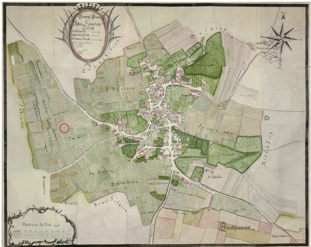
1 Ins, Riserenweg 13. Zehntenplan aus dem 18. Jahrhundert des Dorfes Ins. Roter Kreis: Lage der Grabung 2022.

Die Fundstelle um den Riserenweg befindet sich am westlichen Rand des Dorfes (Abb. 1) auf einer erhöhten Terrasse, die nach Norden und Süden leicht und nach Westen steil abfällt. Von dieser Terrasse aus bietet sich eine weite Aussicht von den Alpen über das Grosse Moos und den Mont Vully bis zum Jura. Die römischen Gebäude lagen oberhalb des Überschwemmungsgebietes des Seelandes. Die Lage ist auch verkehrsgeografisch interessant. Zum einen sind die römischen Strassen durch das Grosse Moos, deren Verlauf uns anhand von Abschnitten einigermaßen bekannt ist, zu nennen. Zum anderen dienten die drei Jurarandseen und die Flüsse Broye und Zihl als Ver-