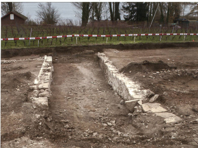
5 La Neuveville, Chavannes. Débarcadère dégagé tout à l'est du chantier de fouille. La maisonnette se dresse au pied de l'ancien mur de rive encore en place. Vue vers le sud.

La densité des aménagements littoraux sur la rive nord du lac s'explique par l'absence de toute route carrossable entre La Neuveville et Biemme jusque vers 1840. Si des sentiers et chemins existaient bien, l'essentiel des transports vers la rive nord du lac s'effectuaient par bateau. D'ailleurs, dans les villages de la rive nord, presque chaque bâtiment ayant accès au lac disposait de son propre débarcadère ; c'est ce qu'attestent les vues de Grimm et surtout les plans cadastraux du 19 e siècle.