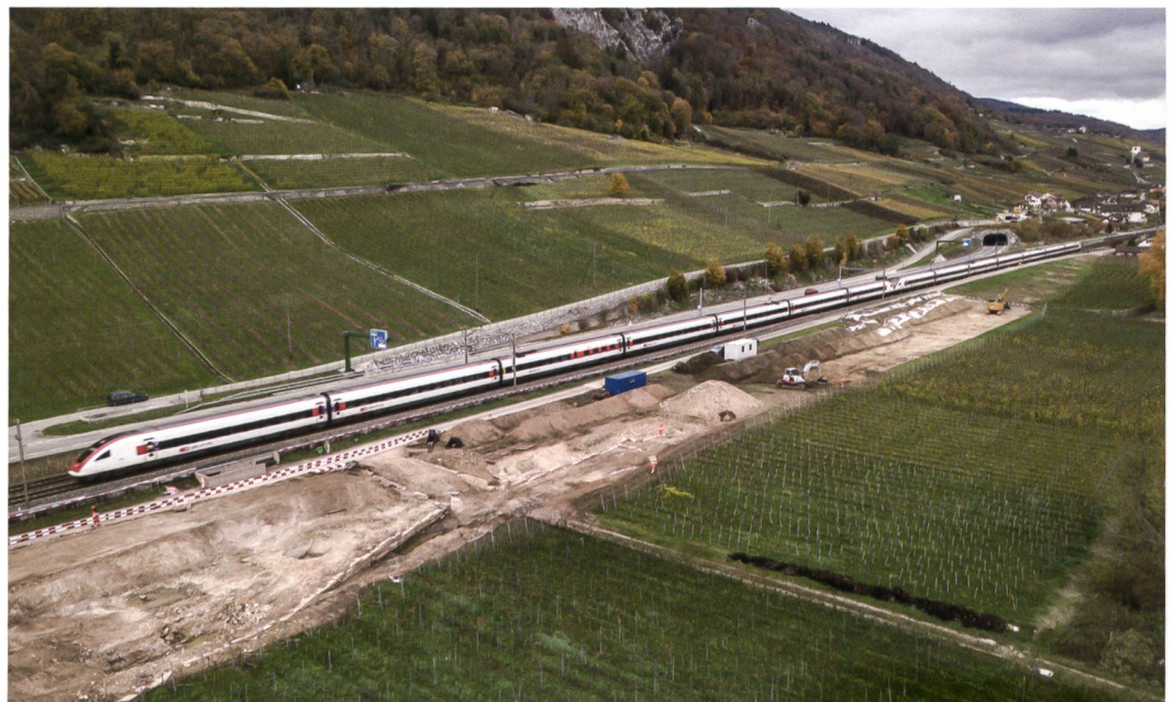
1 La Neuveville, Chavannes. Vue partielle du chantier de doublement de la voie CFF. Vue vers le nord.

et les ceps arrachés dans l'emprise du chantier (fig. 1). La majeure partie des tranchées creusées ont confirmé la présence de marqueurs anthropiques préhistoriques, mais ceux-ci se situaient dans des niveaux profonds, bien en dessous de la cote altimétrique du chantier ; les horizons archéologiques potentiels restaient donc préservés. Par contre, les travaux de terrassement qui se déroulaient parallèlement aux sondages archéologiques sur les quelque 10 000 m 2 de l'emprise du chantier, mirent rapidement au jour des vestiges d'aménagements littoraux (murs et débarcadères) bien conservés qui dataient d'avant la première correction des eaux du Jura (1868-1891). Cette dernière avait provoqué un abaissement de près de 2 m du niveau du lac qui libéra une large bande littorale. Celle-ci fut rapidement envahie par la végétation, puis remblayée avant d'être progressivement consacrée à l'extension de la viticulture dès les années 1960. Réapparus en 2021, les aménagements de rive