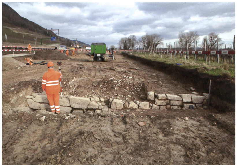
7 La Neuveville, Chavannes. Muret à parement simple, perpendiculaire à la rive, délimitant une des « levées » gagnées sur le littoral. Vue vers l'est.

vannes. Ainsi, la présence d'autres habitats pré- ou protohistoriques dans cette anse favorable, non loin du site palafittique de Chavannes, Steinberg n'est-elle pas exclue. Plus à l'est, aux environs du hameau de Chavannes, les tuiles romaines mises au jour confirment l'existence d'un établissement romain à proximité, peut-être lié à l'extraction de la roche calcaire affleurante et à l'exploitation des fours à chaux découverts à Gléresse en 1998.