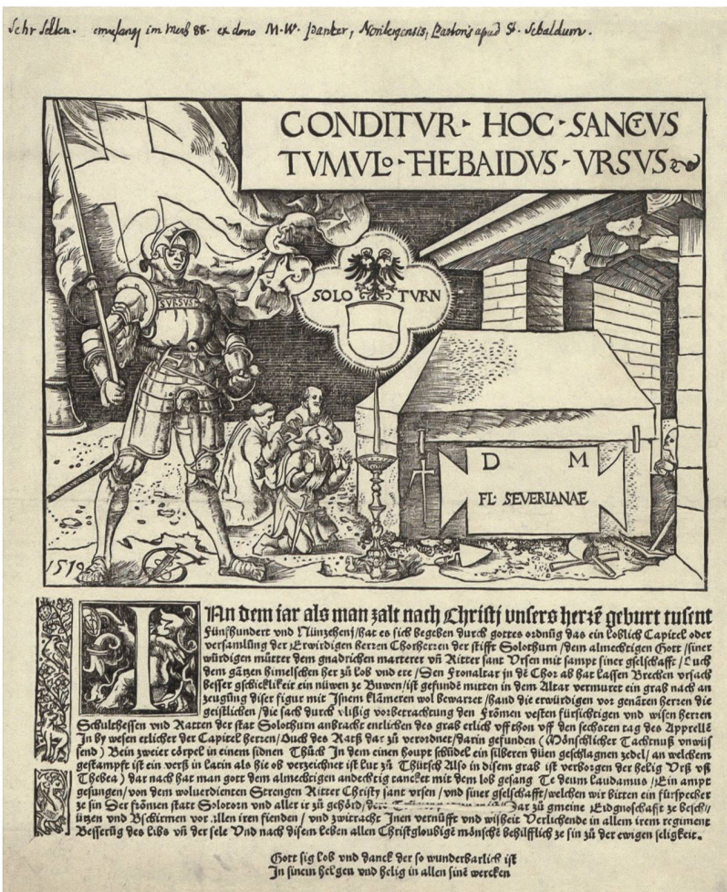
3 Einblattdruck über die Auffindung der Reliquen des heiligen Ursus. Holzschritt und Typendruck, Zuschreibung an Urs Graf (1485–1527), Basel 1519.