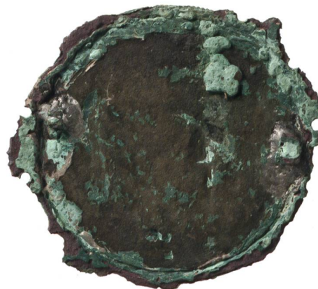
2 Zweisimmen, Uf de Büele. Medaille. a Vorderseite: links im Bild stehend der heilige Ursus, rechts kniend die Königin Bertha. b Rückseite. M. 1:1.

nen die Ausweisung aus der Stadt drohte. Man hatte ihnen sogar schon «Wehr und Eimer» weggenommen, das heisst die kommunalen Anteile jener Ausrüstung, welche jeder Bürger für den obligatorischen Wehr- und Feuerwehrdienst benötigte. Darauf «ergriff Wägrich den längst vergrabenen Stichel, verfertigte die Stempel zum Berthataler und schenkte dieselben am 23. Dez. 1555 MGH [= meinen gnädigen Herren] mit dem Versprechen auf Wohlverhalten. Seinen Zweck hat er damit erreicht, er durfte in der Stadt bleiben [...]».