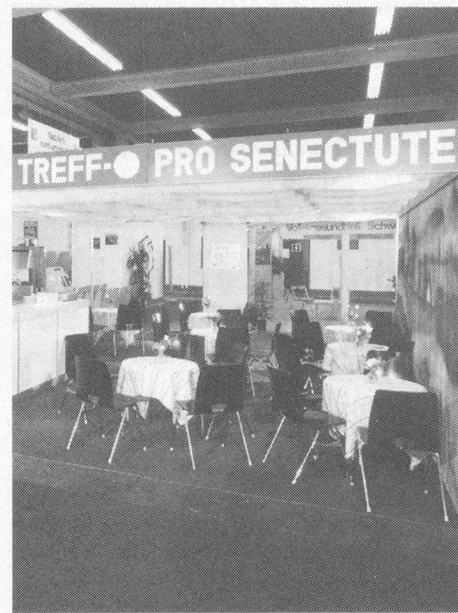
Das Pro Senectute-Käffeli: Ruheinsel im Mubasturm

Was hat Pro Senectute Basel mit «gesundem Brot» zu tun? Auf den ersten Blick scheint die Verbindung zur Natura-Sonderschau «Gesundes Brot» ungewöhnlich. Doch abwegig ist die Beteiligung von Pro Senectute Basel nicht.