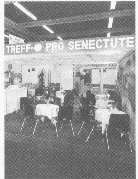
Das Pro Senectute-Käffeli: Ruheinsel im Mubasturm

Was hat Pro Senectute Basel mit «gesundem Brot» zu tun? Auf den ersten Blick scheint die Verbindung zur Natura-Sonderschau «Gesundes Brot» ungewöhnlich. Doch abwegig ist die Beteiligung von Pro Senectute Basel nicht.