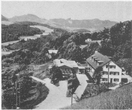
Das schön gelegene Ferienheim HUPP

Noch vor einigen Jahrzehnten haben nicht wenige Basler ihre Ferien im oberen Baselbiet verbracht. Dann sind als Urlaubsziele zunächst die Alpenrandseen, darauf die Alpentäler und schliesslich die Mittelmeerstrände in Mode gekommen. Allenthalben sind aus Bauern- und Fischerdörfern von Autokolonnen verstopfte Ferienstädte geworden, Spazierwege wurden zu Asphaltstrassen, Bergseen und Meeresbuchten zu Rummelplätzen, Luft und Wasser verschmutzt und der Ferienbetrieb durchorganisiert und kommerzialisiert.