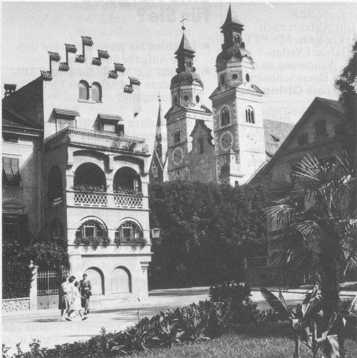
Brixen mit dem berühmten Dom.