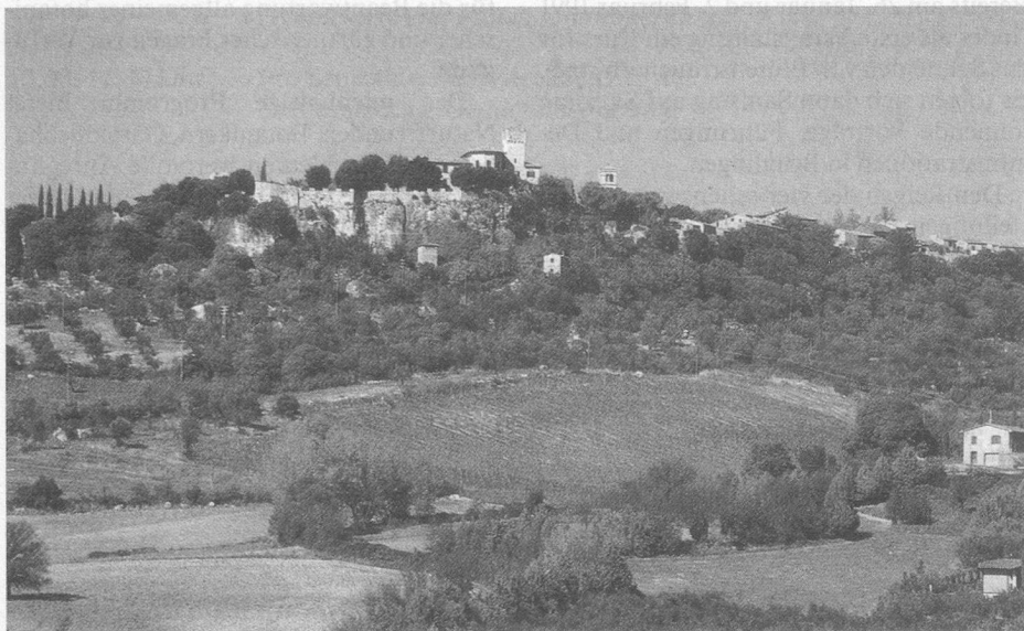
Saturnia, das malerische Dorf inmitten der Toskaner Hügel

Der Standort ist Saturnia , im Herzen der Toskana (Maremma) auf einer Anhöhe gelegen. Das ruhige Dorf ist ein idealer Ausgangspunkt für Ausflüge nach den bekanntesten Etruskerstädten, wie Castel d'Asso, Tarquinia, Tuscania usw. Das Hotel Saturnia, wo wir logieren, hat einfache, saubere Zimmer mit Dusche/WC und verfügt über eine ausgezeichnete toskanische Küche.