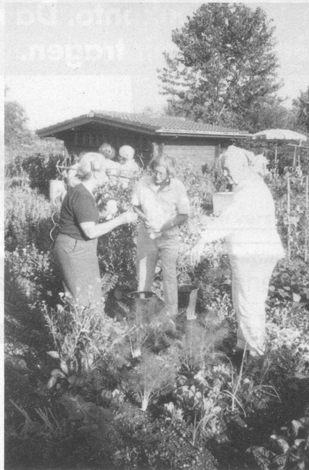
... und heute!