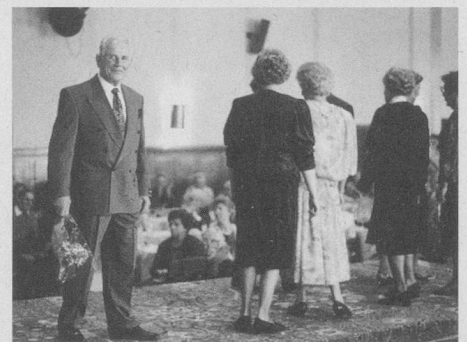
Der elegante Herr – gesehen an der Modenschau vom Polka-Träff in Liestal.

Leitung und Auskunfte: Erika und Paul Rudin-Strub Telefon 061-921 12 65