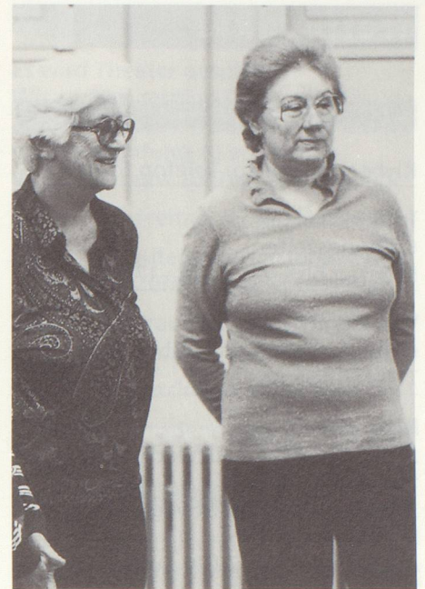
Bewegung und Gemeinschaft – auch zuzuschauen gehört dazu