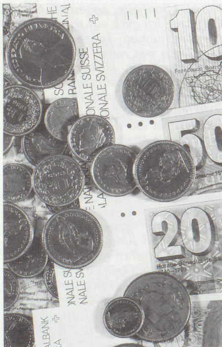
Der Betrag setzte sich aus vielen kleinen und grossen Spenden zusammen.