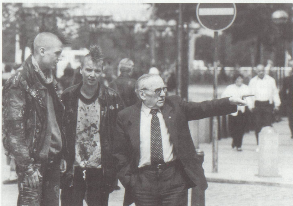
Ohne Toleranz und Solidarität zwischen Jung und Alt kein Generationenvertrag