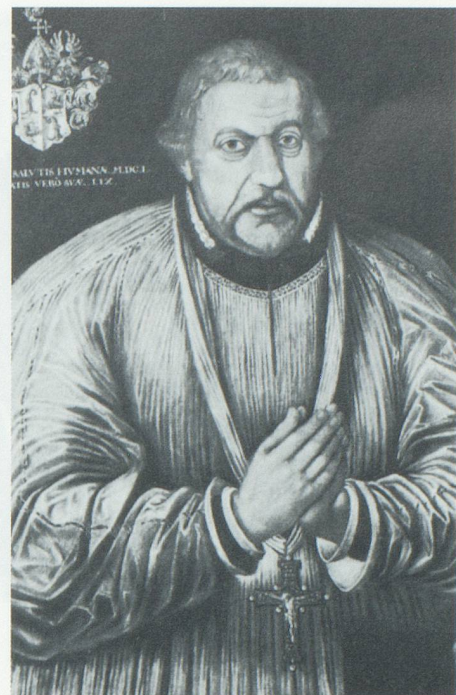
Fürstbischof Jakob Christoph Blarer

1782 isch dr Joseph Sigismund von Roggebach Fiirschtbischof worde, e Maa vo dr franzeesischen Uffgläärig mit modäärnen Idee fir d Finanze, fir s Schuel- und Aarmewäase. Aaber das het em nyt gnutzt. Dr Gaischt vo dr Franzeesische Revolutioon het um sich griffe, und wo uus em habsbuurgische Friggdaal kaiserliche Druppe