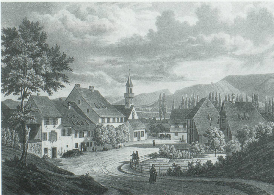
Die Gebäudegruppe von St. Jakob. Stich von 1843.

Ihm gehörte das Land, auf dem heute der Güterbahnhof Wolf steht und das Zeughaus, Land bis an die Gellertstrasse, weit über das heutige Areal des Bethesda Spitals hinaus, das Land um die St. Jakob Schlachtkapelle ebenso wie das Gelände, auf dem das St. Jakob-Stadion steht, die Sporthalle, das Schwimmbad und die Sportplätze am linken Birsufer, bis hinaus zur Neuen Welt in Münchenstein, ferner das ganze Dreispitzareal