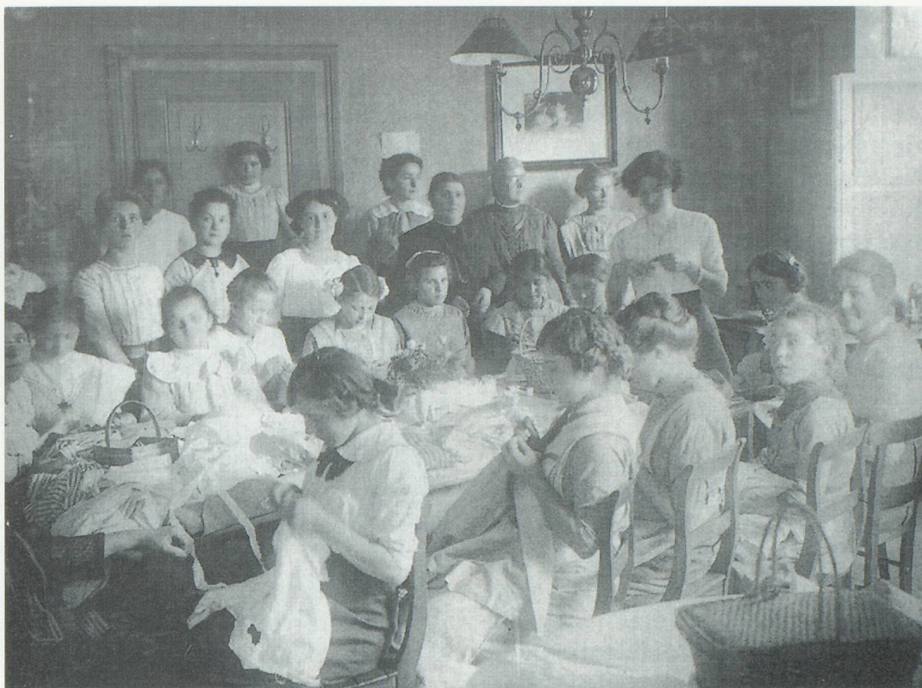
Nähstunde für Dienstmägde

Nicht dass Basel eine Ausnahme gewesen wäre. Im benachbarten Frankreich, mit seinen unerträglichen inneren Ungerechtigkeiten, der Erstarrung der staatlichen und sozialen Einrichtungen und dem moralischen Niedergang der herrschenden Schichten, kündigte sich die grosse Revolution an. In der Eidgenossenschaft und auch in Basel waren die Verhältnisse etwas