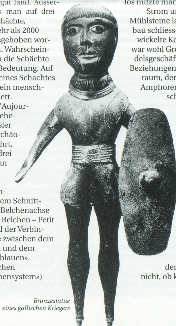
Bronzestatue eines gallischen Kriegers

Was aber besonders interessant ist: Nicht auf dem Münsterhügel, sondern in der Siedlung am Rhein, lebten die ersten uns bekannten «Basler». Noch vor der Zeitwende verliessen die Rauriker den Platz. Man weiss nicht, ob kriegerische Über-