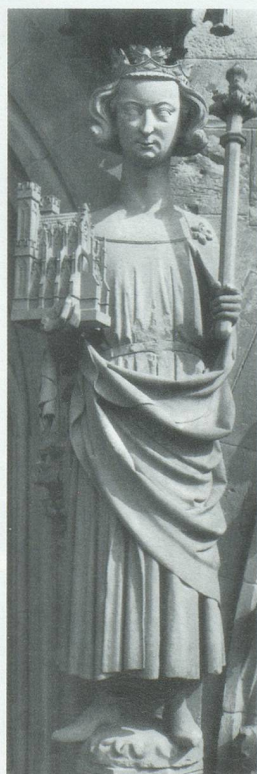
... und Heinrich