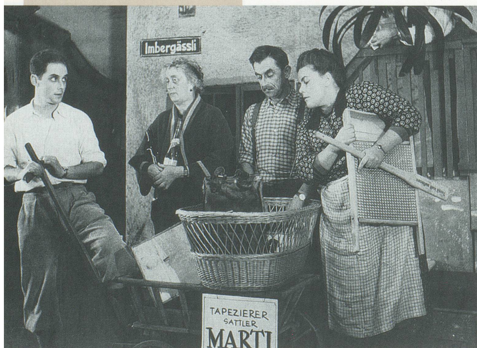
«Imbergässli 7» 1947

Ort Basler Marionettentheater, Münsterplatz Daten 13. / 19. / 20. und 21. März