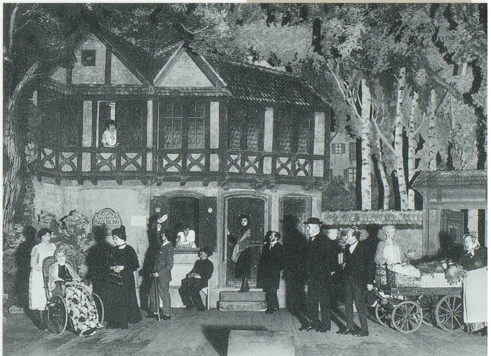
«Unerdem glyche Dach» 1927/1943

1892 wurde die Dramatische Gesellschaft Basel gegründet. Mit einer Ausnahme wurden bis 1925 ausschliesslich schriftdutsche Stücke gespielt. 1925 erfolgte die Gründung der Dialektgruppe «Baseldytschi Bihni». In den Anfangszeiten hatte die «Baseldytschi Bihni» keine feste Bleibe. Sie musste die Probe- und Aufführungsorte immer wieder wechseln. Daneben ging sie auf Tournee durch verschiedene Schweizer Städte. Während dem 2. Weltkrieg spielte sie an der Front und gab sich 1942 den Zusatztitel «Basler Heimatschutz-Theater», den sie noch immer in ihrem Namen führt. Ein Meilenstein stellte 1962 der Bezug des eigenen Theaterkellers an der Leonhardsstrasse 7 dar. Dort spielte die «Baseldytschi Bihni» bis 1995, als sie der baselstädtischen Schulreform weichen musste. Sie hatte aber sehr viel Glück im Unglück und fand im Lohnhof eine neue Bleibe, wo sie seit 1996 spielt.