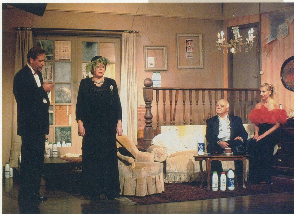
«Grille und Ameise»

Hauptfigur ist Aristoteles Christ, ein Aussteiger, der mit seinen vielen unehelichen Kindern und Tieren in einfachen Verhältnissen lebt. Eines Tages erscheint überraschenderweise seine ehemalige Frau Chantal Christ Iselin und will ihn verpflichten, zur Hochzeit ihres gemeinsamen Sohnes zu kommen. Die Vorstellung, sich wieder in der etablierten Gesellschaftsschicht bewegen zu müssen, bereitet Aris Angst. Er lehnt ab und nun beginnen die Turbulenzen. Nichts wird so bleiben, wie es vorher war ... «Grille und Ameise» ist ein sehr unterhaltsames Stück, welches mit viel Liebe fürs Detail und überzeugenden schauspielerischen Leistungen einen kurzweiligen Abend garantiert.