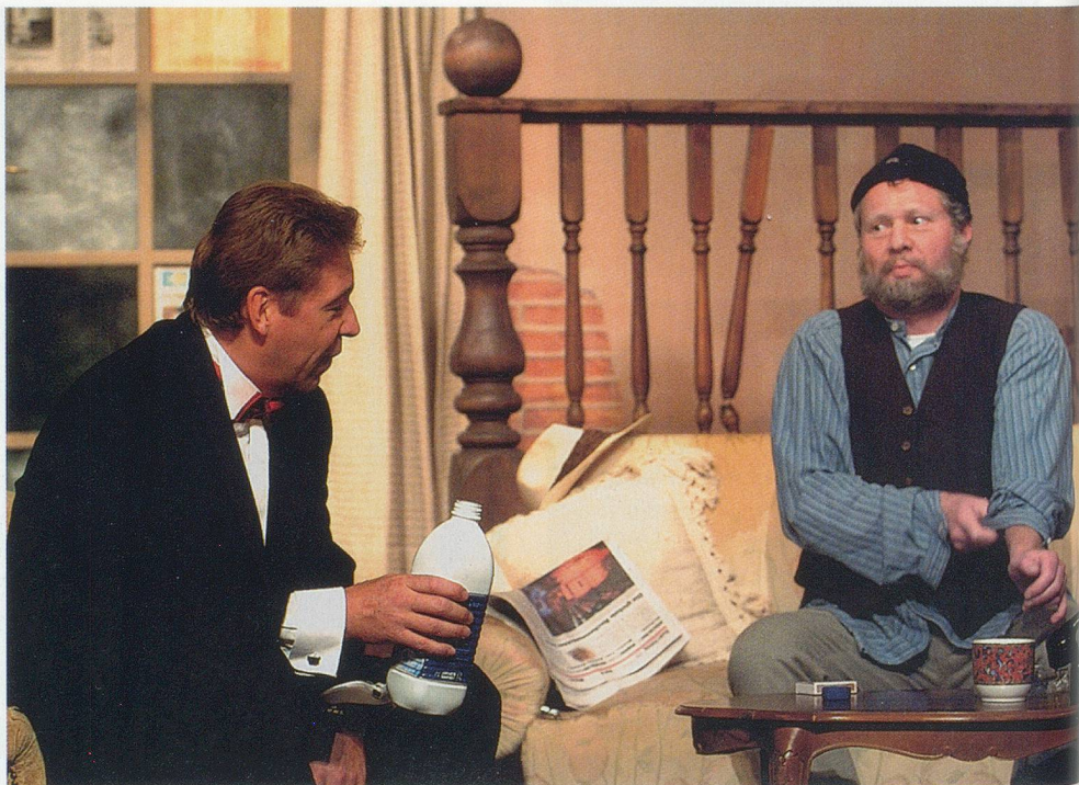
«Grille und Ameise»

Man kann ja nicht, wenn wir Baseldeutsch sprechen, die Geschichte irgendwo in Lappland spielen lassen. Das funktioniert nicht. Der Dialekt ist immer ortsgebunden. Das ist meine persönliche Auffassung und danach versuchte ich mich zu richten. Gerade im aktuellen