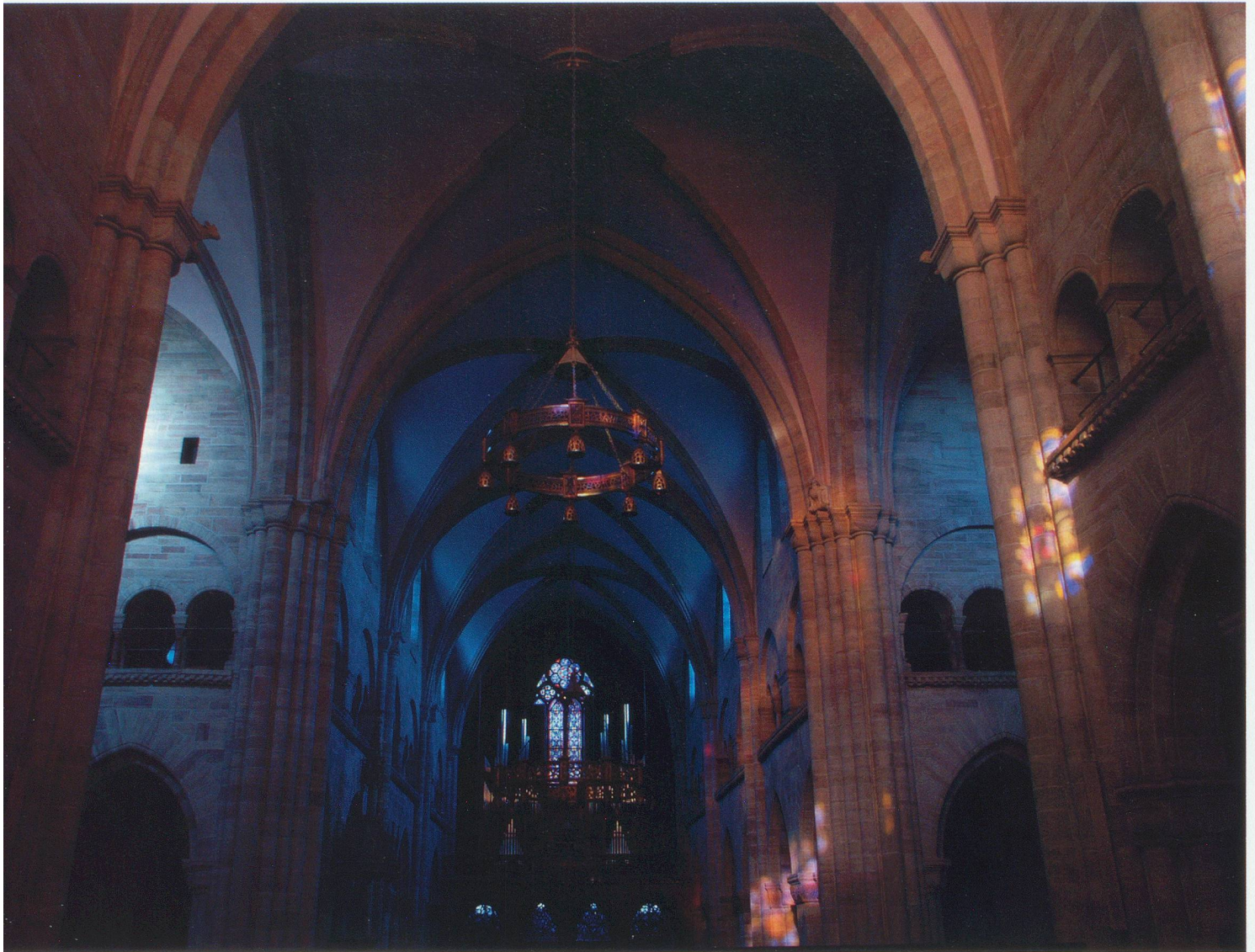
Im Basler Münster am 24. Juni (Sonnenaufgang)

Wie das im 9. Jahrhundert unter Bischof Haito karolingische errichtete Rundturmmünster, wurden im Mittelalter viele Kirchen nach Osten ausgerichtet. Der Sonnenaufgang stand für den aufsteigenden und siegreich wiederkehrenden Christus. Mit Blick nach Osten bestattete man die Toten und auch der Priester, der vor dem Altar stand, wandte sich nach Osten.