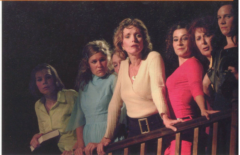
«Die acht Frauen» von Robert Thomas – mit Liedern und Songs von Georg Kreisler

Leiter der Truppe stolz fest. Heute ist die Elisabethenkirche zu einem kulturellen Zentrum geworden, in dem auch das Theater Basel im letzten Jahr eine Faust-Inszenierung realisierte.