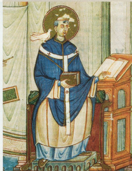
Papst Gregor (Buchmalerei um 983)

Sein Biograf, Papst Gregor der Grosse, schildert, wie Benedikt Herr über seine Begierden wurde, die Fleischeslust besiegte, Kranke heilte und in Wort und Tat immer mehr zum «Lehrmeister der Tugend» und zum «Mann Gottes» heranreifte. Der Ruhm Benedikts gründet jedoch nicht allein auf dem Werk Gregors. Die Nachwelt kennt ihn vor allem als Verfasser der Regel für eine klösterliche Gemeinschaft.