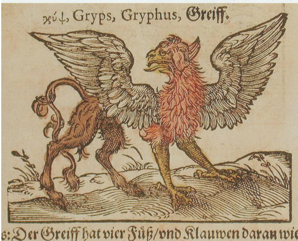
... in mittelalterlichem Holzschnitt (Frankfurt a.M., 1584) ...

Bis in die frühe Neuzeit hielten viele Menschen Drachen für real existierende Wesen. Plinius d.Ä. (23–79 n.Chr.) berichtet in seinem Werk «Naturalis historia» von einem Drachen, der auf dem Vatikanhügel in Rom sein Unwesen trieb. Über Autoren, die in mittelalterlichen Klöstern auf antike Schriften solcher Art