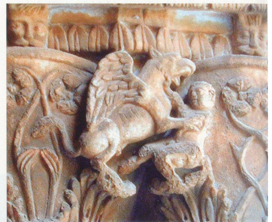
... in der Romanik (Monreale, Sizilien 12. Jhd.) ...

Aufgrund des Pferdehasses von Greifen, zählt der Hippogreif zu den sonderbarsten greifähnlichen Wesen. Er ist das Ergebnis der seltenen Verbindung eines Greifs mit einer Stute. Der Hippogreif besitzt Kopf, Flügel und Vorderbeine eines Greifs, während Hinterteil und Hinterbeine diejenigen eines Pferdes sind. Anders als Greife können Hippogreife gezähmt und durch die Lüfte geritten werden. So sollen, wie mehrere Legenden berichten, Ritter Karls des Grossen Hippogreife als Reittiere benutzt haben – genauso wie es Harry Potter in einem seiner Abenteuer tut.