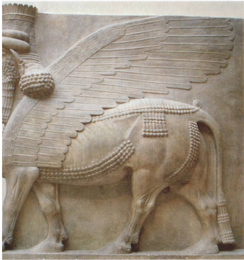
Der Greif bei den Assyern (Taurogreif, 714 v.Chr.) ...