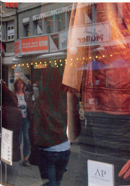
Bildlegende: Oben: Vor dem Schaufenster der Manor in der Greifengasse Rechts: Vor der Migros beim Claraplatz

Unterschicht an und waren - im Gegensatz zu den reformierten Baslern - überwiegend katholisch, kurz, rundum fremd.