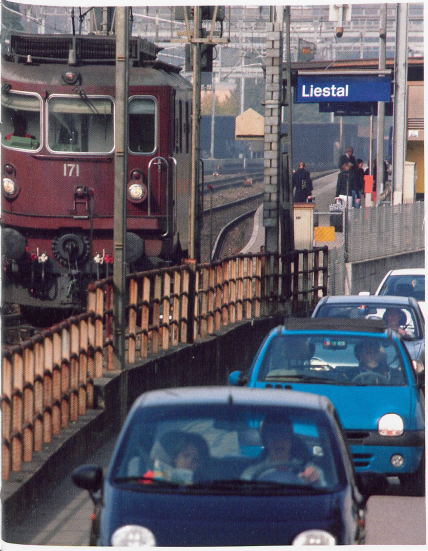
Bildlegende: Oben: Basel Bahnhof SBB, 07:45 Uhr Mitte: Schnellstrasse Liestal - Basel Rechts: Strasse bei Bahnhof Liestal

Degenzwillinge aus Lampenberg dem FCB zu Höhenflügen. Und wie ist das nun eigentlich mit Roger Federer? Darf er als «Basler» bezeichnet werden? So wie das in den Medien häufig geschieht. Sieht sich «unser Roger» als Basler? Als Baselbieter? Oder steht er nicht einfach über diesem «Kantönleiste»?