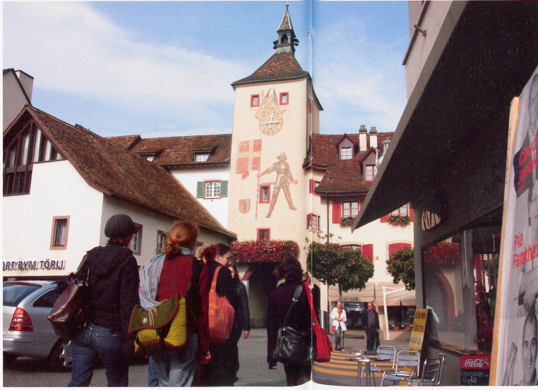
Bildlegende: Unten: Städtli, Liestal Rechts: Städtli, Liestal

Verwendete Literatur: Kreis Georg/von Wartburg Beat (Hrsg.), Geschichte einer städtischen Gesellschaft, Basel: Christoph Merian Verlag, 2000. Leuenberger Martin/Schneider Hans Rudolf , «Kommen Sie zu uns nach der Landschaft, in Basel ist keine Luft für Sie!». Die Revolution in Baden und die Flüchtlinge im Baselbiet, in: Christoph Merian Stiftung (Hrsg.), Basler Stadtbuch 1998. Ausgabe 1999. 199. Jahr, Basel: Christoph Merian Verlag, 1999. Thommen Michèle , Der Pendler als Indikator für erhöhte Mobilität und die zunehmende Vernetzung in industriellen und