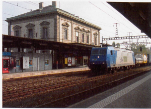
Bildlegende: Oben: Stadttor Liestal Unten: Bahnhof Liestal

Statistik Baselland (Hrsg.), Wanderungsbilanz des Baseltals seit 1980, Liestal: 2006.