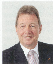
Peter Zwick Vorsteher Volkswirtschafts- und Gesundheitsdirektion Basel-Landschaft

Ich wünsche der Pro Senectute beider Basel im Namen der Basler Regierung eine gute und fruchtbare gemeinsame Zukunft.