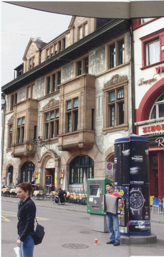
Bildlegende Seite 2: Treppe auf dem Barfüsserplatz Oben rechts: Grand Café Huguenin Oben: Brasserie «Zum braunen Mutz» Unten rechts: Stadtreinigung bei Tramhaltestelle Barfüsserplatz Unten links: Mc Donalds am Barfüsserplatz

Die Nachricht, dass die traditionsreiche Brasserie «Zum Braunen Mutz» am Barfüsserplatz wahrscheinlich in absehbarer Zeit geschlossen werde, da der Pachtvertrag Mitte 2010 ausläuft, machte im Januar 2008 Schlagzeilen. Dass die Fastfood-Kette Burger King und die Betreiber einer Nobelboutique daran interessiert sein sollen, ins Haus am Barfüsserplatz 10 einzuziehen, kann nicht überraschen in einer Zeit, wo die gesellschaftliche Konsumlust ihren Niederschlag im Bau einer Vielzahl von neuen Shopping-Zentren