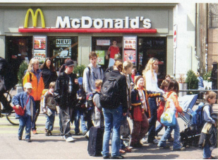
Bildlegende Seite 2: Treppe auf dem Barfüsserplatz Oben rechts: Grand Café Huguenin Oben: Brasserie «Zum braunen Mutz» Unten rechts: Stadtreinigung bei Tramhaltestelle Barfüsserplatz Unten links: Mc Donalds am Barfüsserplatz

findet. Die Projekte auf dem Areal der alten Stückfärberei, der geplante Südpark auf der Gundeldinger Seite des Bahnhofs SBB und das Elenmatt-Projekt mögen da nur drei prominente Beispiele sein. Viele Basler waren ob der Nachricht dennoch entsetzt und brachten ihren Ärger in emotionalen Leserbriefen an die Basler Zeitung zum Ausdruck.