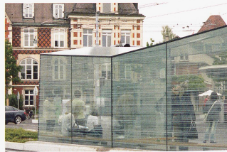
Bild oben rechts: Neue Tramstation Wettsteinplatz Bild Mitte: Alltag im Wettstein-Quartier Bild unten links: Tinguely Museum Bild unten rechts: Rheinpromenade im Wettstein-Quartier