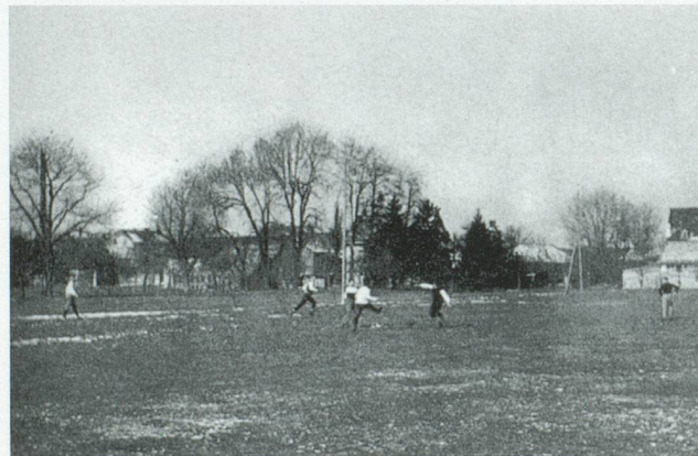
FCB-Training auf dem Landhof 1893