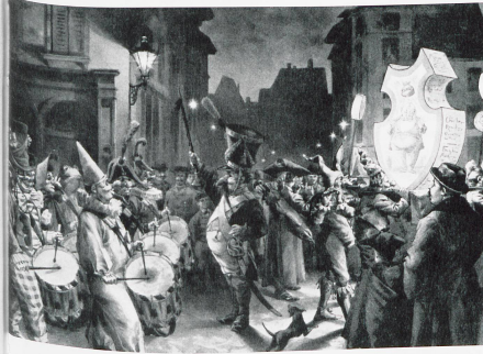
Bild Seite 2: Barbara Club in Basel Bild oben: Faschingszug in Basel, 1843 Bild Mitte: Prinz Carneval, bis 1911 anzutreffen Bild unten: Ende des 19. Jahrhunderts gehören die Militäruniformen immer weniger zum Strassenbild am Morgenstreich. Fasnachtsumzug, 1897

wilde Tiere und schandbare schnöde Lieder singen». Am Aschermittwoch zeichnete der Priester den Gläubigen ein Aschenkreuz auf die Stirn und erinnerte ihn an seine Vergänglichkeit: «Gedenke, o Mensch, du bist Staub, und zum Staube kehrst du zurück». Papst Urban II. führte diesen Brauch im 11. Jahrhundert ein. Im 12. Jahrhundert wurde festgelegt, dass die Asche von Palm- und Ölzweigen des vorjährigen Palmsonntags dafür gewonnen werden musste.