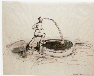
Bild unten links Bruce Naumann (geb. 1941), «Myself as a Marble Fountain», 1967 Emanuel Hoffmann-Stiftung, Depositum im Kunstmuseum Basel