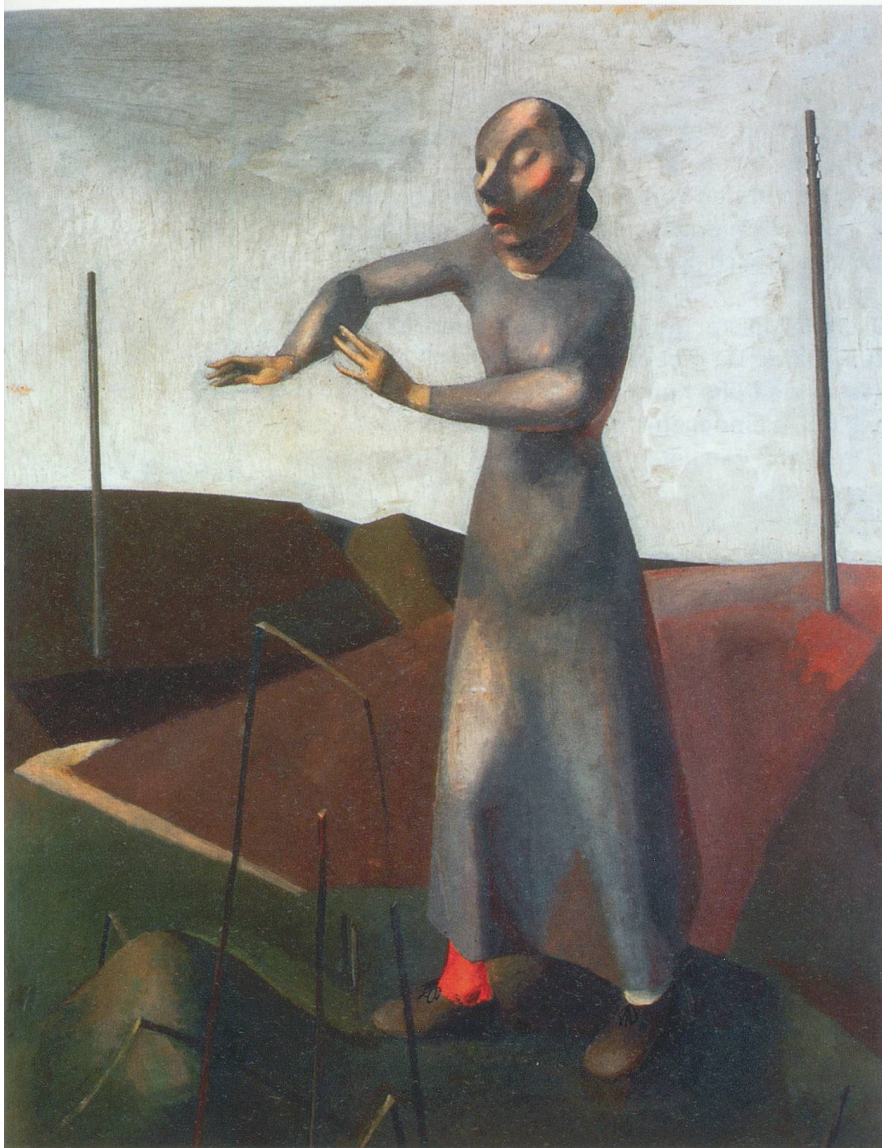
Bild oben Niklaus Stoecklin, «Die Blinde», 1918 Öffentliche Kunstsammlung Basel