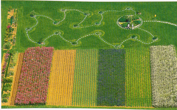
Bild oben: Ricola Produktion Bild links oben: Ricola Fabrikationsgebäude Bild links unten: Ricola Kräutergarten