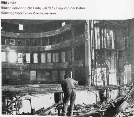
Bild unten Beginn des Abbruchs Ende Juli 1975; Blick von der Bühne (Klostergasse) in den Zuschauerraum.