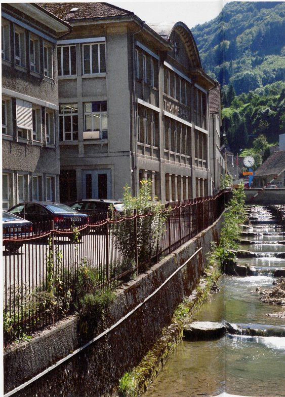
Bild oben Die Revue Thommen AG an der Vorderen Frenke in Waldenburg

Dass das Leben der Fabrikler und Fabrikierinnen um die Jahrhundertwende 12 Stunden Arbeit rund um die Uhr bedeutete, wissen wir aus Erzählungen, Fabrikordnungen, Arbeitskämpfen und Statistiken. Welche Arbeiten jene Menschen jedoch stundenlang verrichteten und wer sie waren, sie, die sich oft nichts sehnlicher wünschten als «heraus aus dem Dreck und Gestank, heraus aus der Not und dem Elend» zu kommen, lässt sich heute nur vermuten. Schriftliche Quellen oder Arbeitsberichte gibt es kaum, so dass sie als Namenlose höchst selten im gängigen Geschichtsbild erscheinen. Wie beschreibt es Brecht doch so treffend in seinem Gedicht «Fragen eines lesenden Arbeiters»: Wer baute das siebentorige Theben?/In den Büchern stehen die Namen von Königen/Haben die Könige die Felsbrocken herbeigeschleppt?