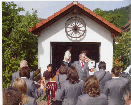
Bilder Hebel-Tag in Hausen 2009