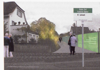
Bild links Links und rechts von der Baselstrasse grenzen hohe Mauern den Sarasinpark, das Berowergut samt der Fondation Beyeler sowie das Dorf von der Strasse ab.