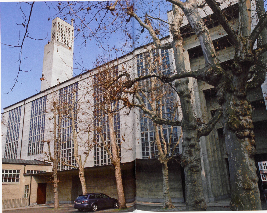
Karl Moser, 1920

Die Antoniuskirche im St. Johann-Quartier ist Karl Mosers Spätwerk und steht im Zeichen des Neuen Bauens, einer Stilrichtung aus den Jahren 1910-1930, die im Kontext mit dem Bauhaus zu sehen ist. Eine Kirche ganz aus Beton, ausserlich den damaligen In- dustriebauten nachempfunden, das war ein mutiger, neuer Schritt, den viele Menschen zu jener Zeit nicht nachvollziehen konnten. So kam die Antoniuskirche zur wenig schmeichelhaften Bezeichnung «Seelen- silo». Tatsächlich gab es zu jener Zeit erst eine bekannte Kirche, die in dieser Art gebaut worden war: die vom französischen Ingenieur-Architekten Auguste Perret 1923 errichtete Betonkirche Notre-Dame in der Ar- beiterstadt Le Raincy, östlich von Paris. Erst dreissig Jahre später, 1955, entstand dann Le Corbusiers be- kannte Kapelle Notre-Dame-du-Haut in Ronchamp, deren Aussenwände aus Sichtbeton bestehen.