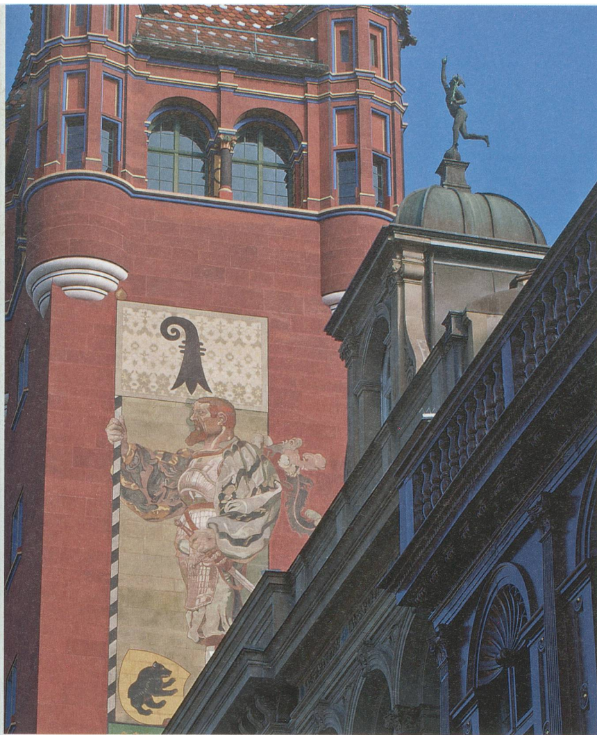
1501: Bundesschwur auf dem Kornmarkt