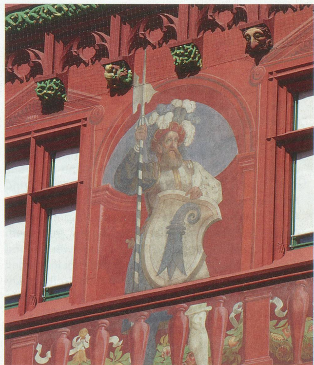
Fresko am Basler Rathaus

Seit dem 11. Jahrhundert war Basel, das unter der Herrschaft des Bischofs stand, Teil des Heiligen Römischen Reichs Deutscher Nation. Ursprünglich war die Stadt umgeben von zahlreichen Adelherrschaften, deren Besitz im heutigen Baselbiet ab dem 14. Jahrhundert nach und nach von reichen Bürgern, später von der Stadt selber aufgekauft wurden. Gleichzeitig gelang es der städtischen Obrigkeit, vom ständig verschuldeten Fürstbischof zahlreiche Herrschaftsrechte zu erwerben und sich so, voreerst